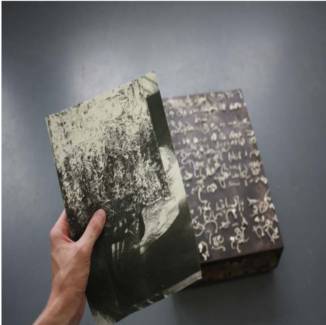
Mobile Artwork & Text Performative interventional installation Performer, digital print on A4 paper, modeling clay on concrete variable in size 2016