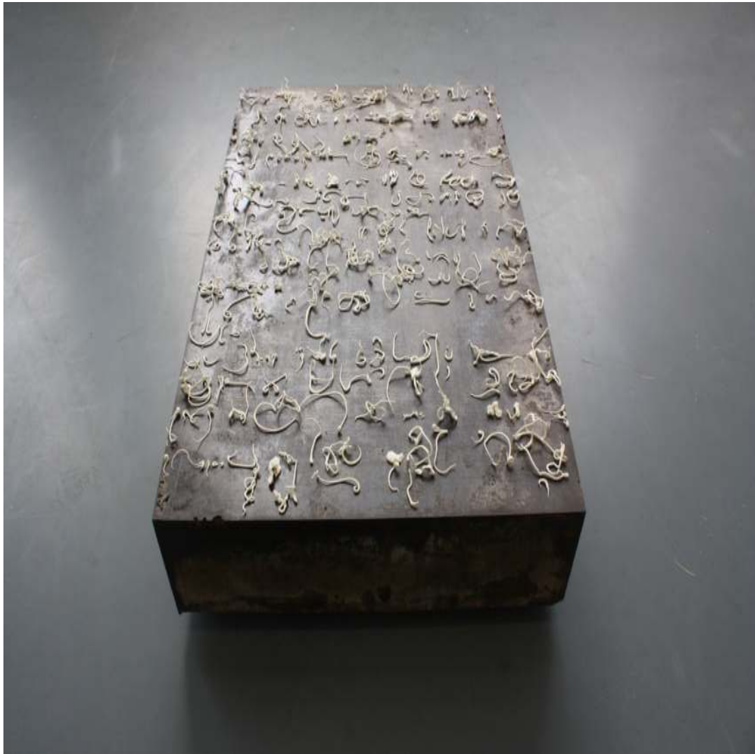
Text Sculptural text Modeling clay on concrete 22 × 32¼ × 7¾ inch / 57 × 82 × 20 cm 2016