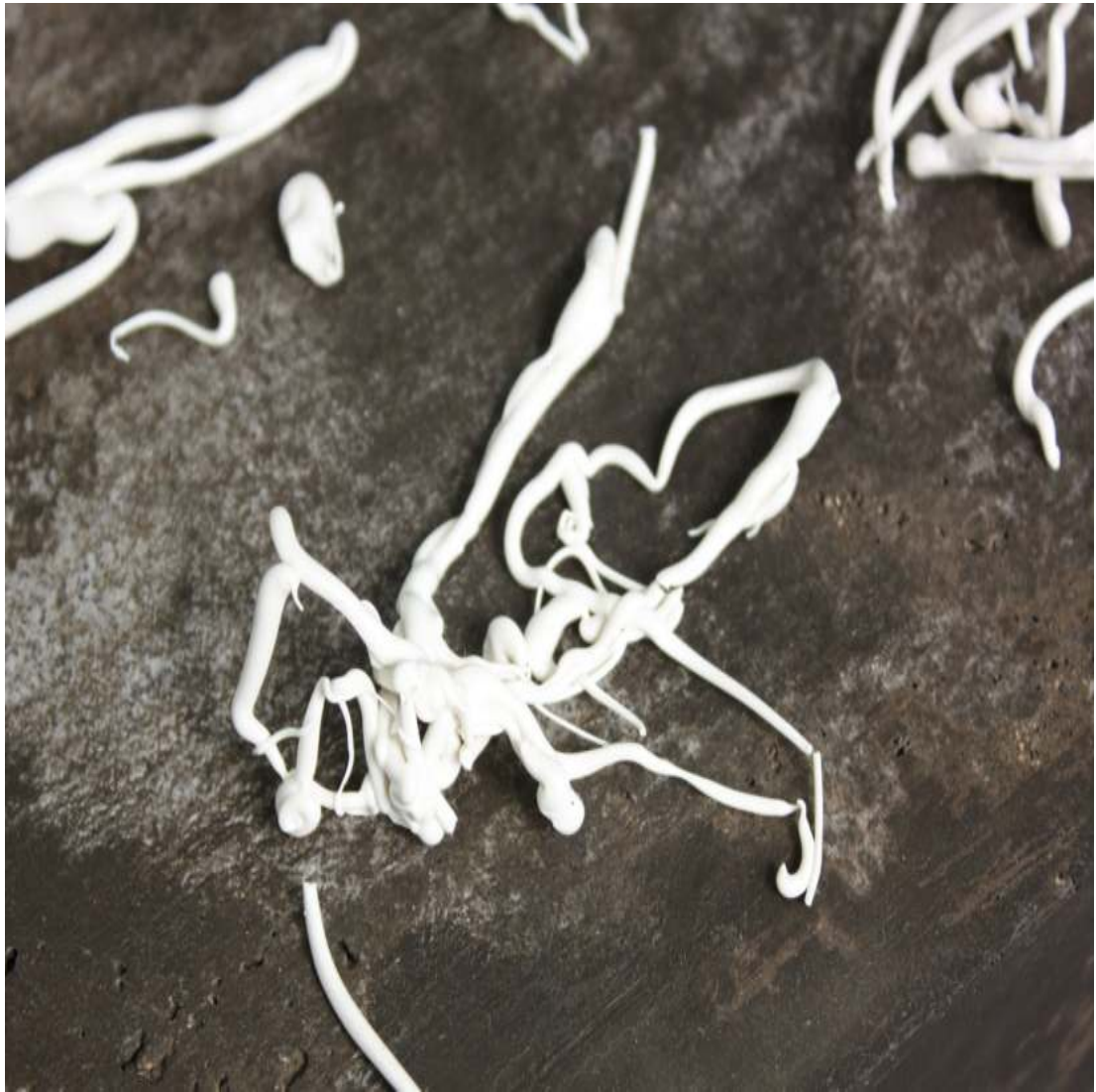
Detail of Text Sculptural text Modeling clay on concrete variable in size 2016