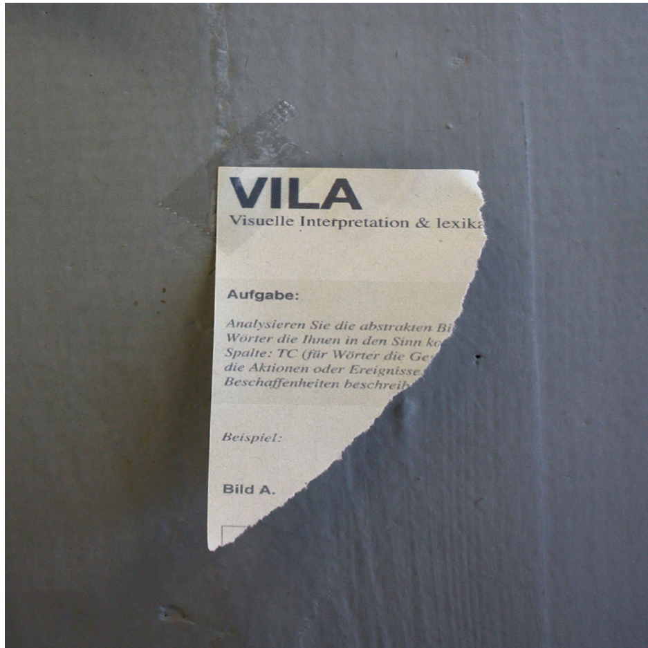
VILA Detail from VILA installation Digital print on paper 2¾ x 1½ inch / 7 x 4 cm variable in size 2016