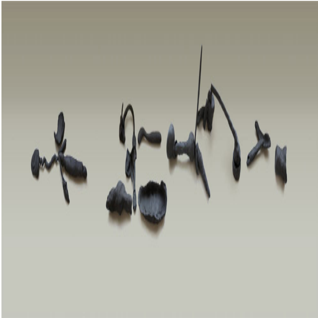
Of Antas, Saudade and tracing the Hours: explanation and making meaning with Rivas Rivas Ceramic-phonemic translations Digital photographs of ceramic objects on rendered background 59 × 9¾ × 5¾ inch / 150 × 25 × 15 cm variable in size 2015