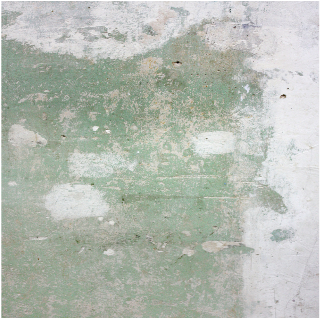
Infocommunicative Processes: In Our Time Sample digital images of exhibited wall surface Found surface variable in size 2015