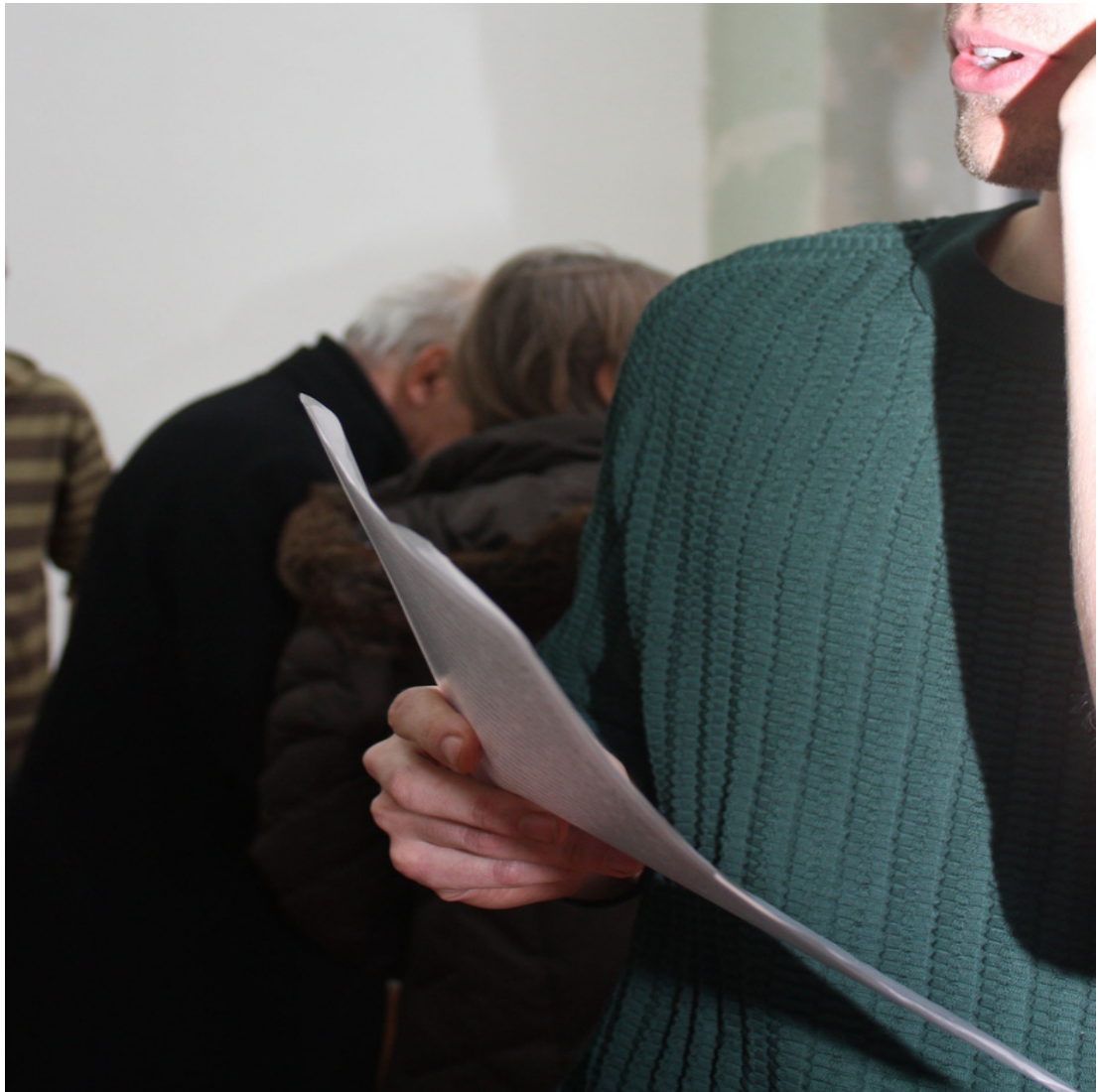
Infocommunicative Processes: Co-text 25.11.15, 19:00-22:00 Photograph taken by performer (assistant's assistant) as result of vague instructions Digital image variable in size 2015