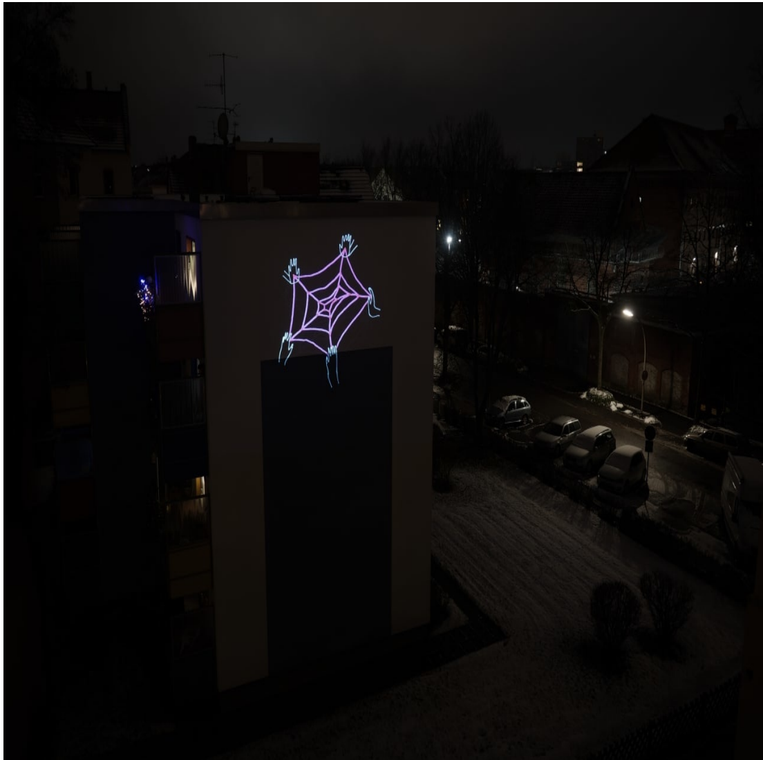
Netzwerk (Versuch) 2020