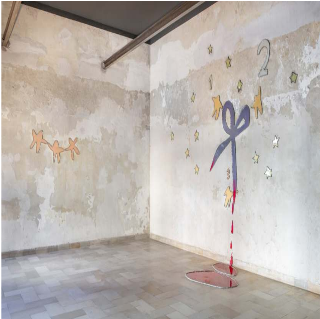
1 2 3 Freunde oder nicht variable in size 2019