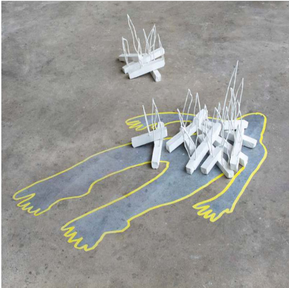
„I'm burning my body (es ist kalt hier) 15¼ x 118 x 118 inch / 40 x 300 x 300 cm 2019