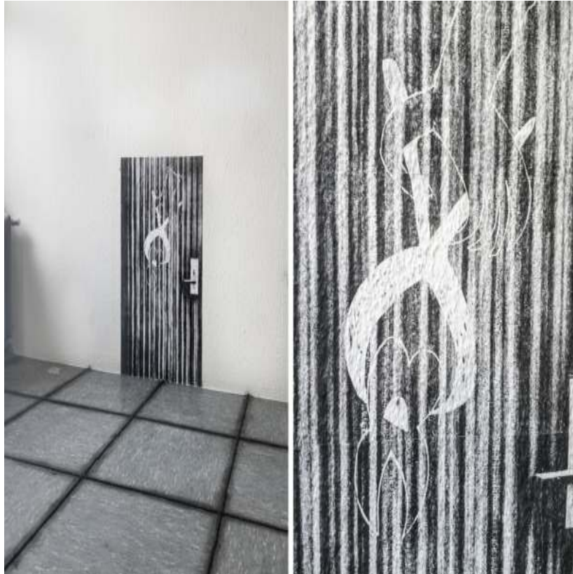
hier gehts zum Zahnarzt (einer hat gelogen) (from Wartezimmer (welche Tür wirst du nehmen)) 24½ × 45¼ inch / 62.3 × 115 cm 2021