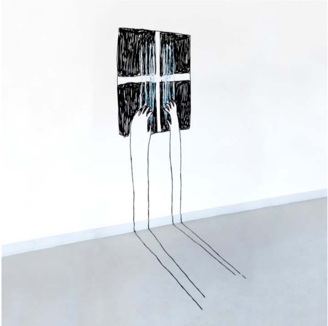
sie kratzen an / den Fenstern / bei Nacht 86½ x 51 x 62¼ inch / 220 x 130 x 160 cm variable in size 2020