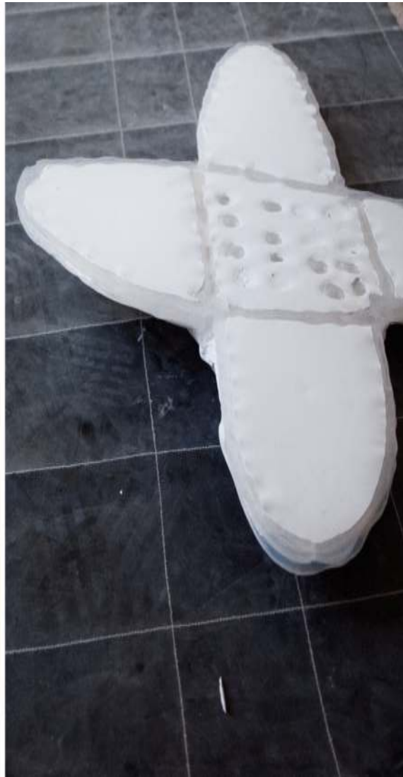
Heilungsprozess auf Sonnenbrand 62¼ x 86½ x 19 inch / 160 x 220 x 50 cm 2020