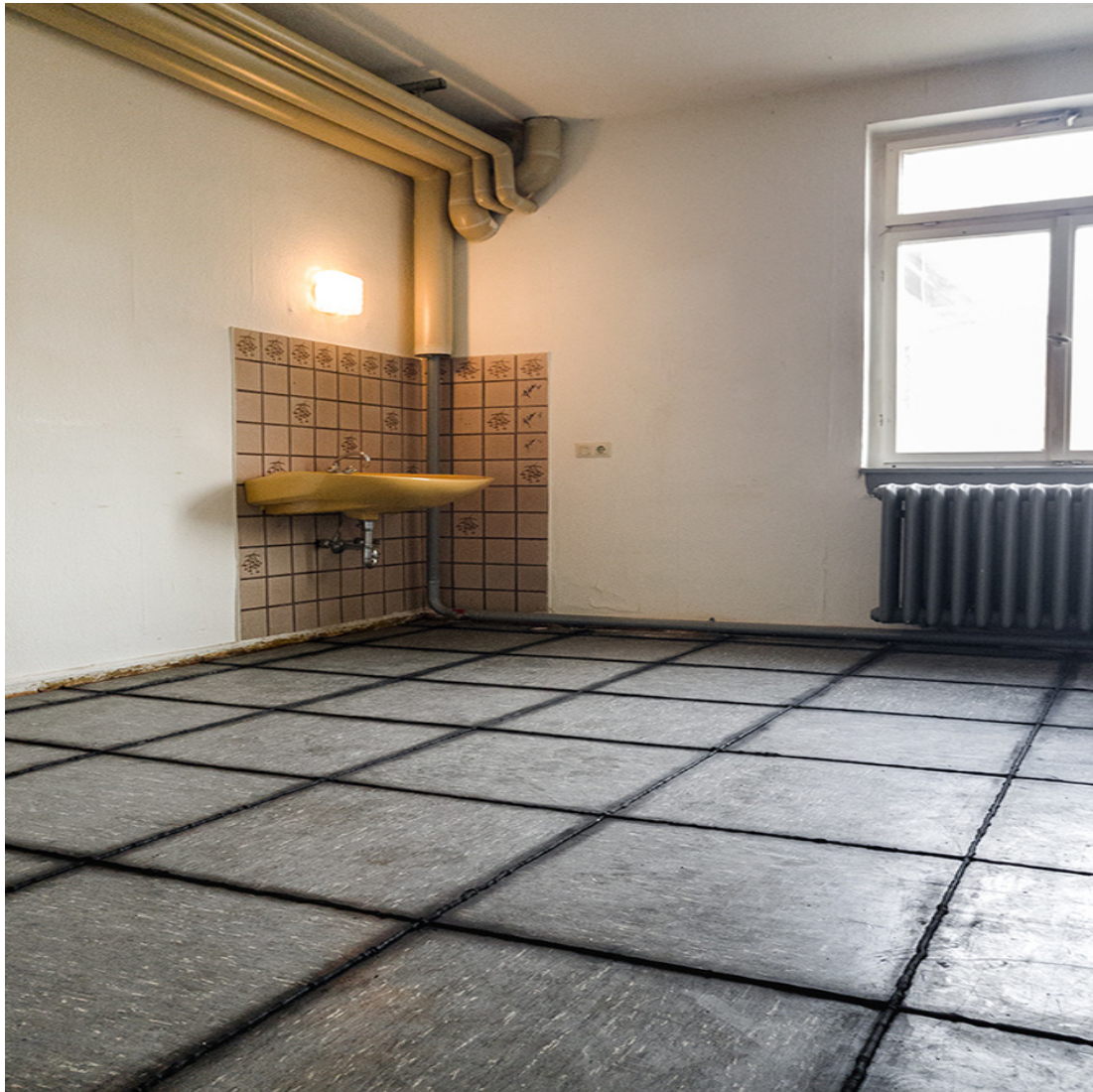
der Dreck in den Fugen (für Colani) (from Wartezimmer (welche Tür wirst du nehmen)) variable in size 2021