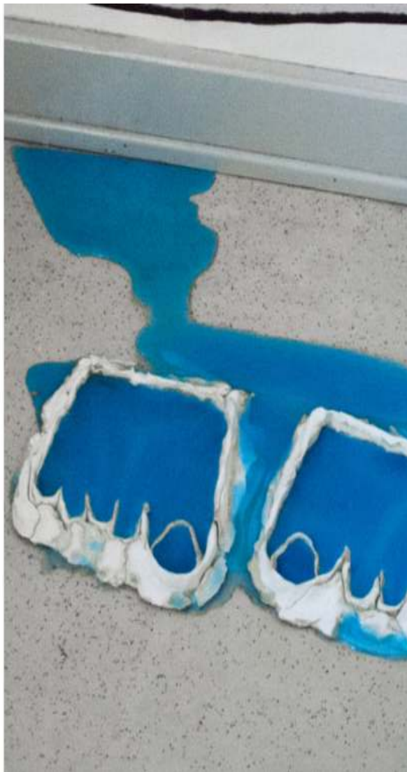
kalte Füße 78 x 39¼ x 15¼ inch / 200 x 100 x 40 cm 2020