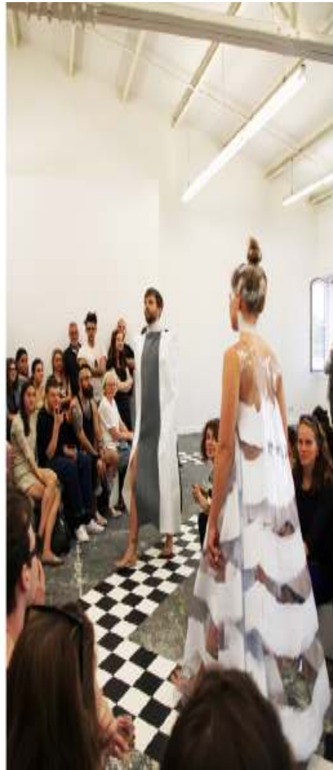
En Vogue Fashion Show (Performance) 2015