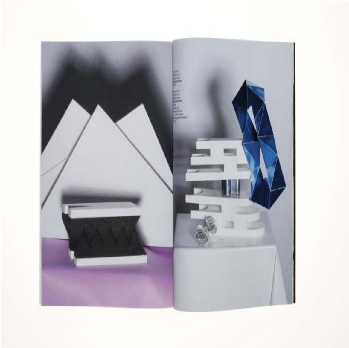
CHIC Magazine 10¼ x 8 inch / 27.7 x 21.3 cm 2016