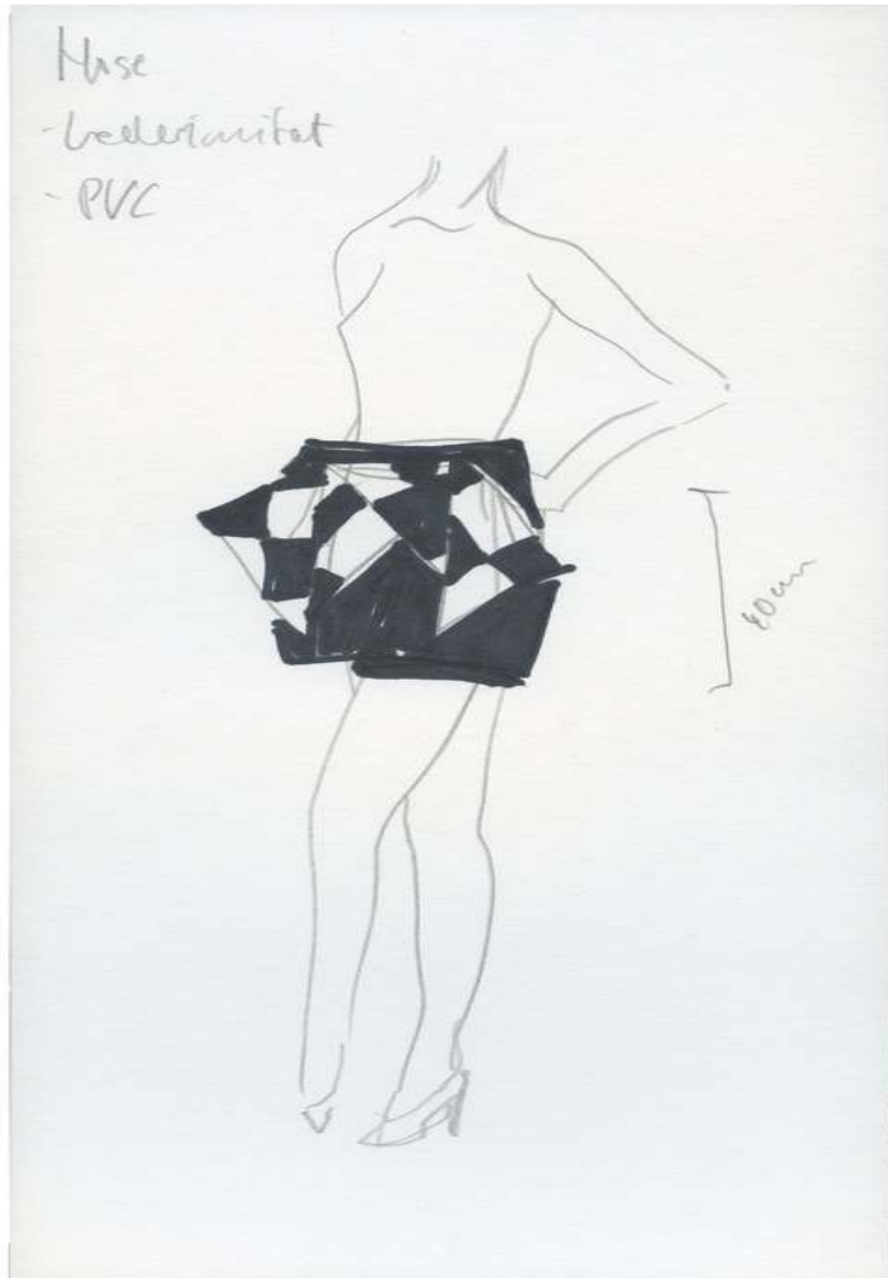
Design for En Vogue Drawing and Collage 10 x 5¼ inch / 27 x 15 cm 2015