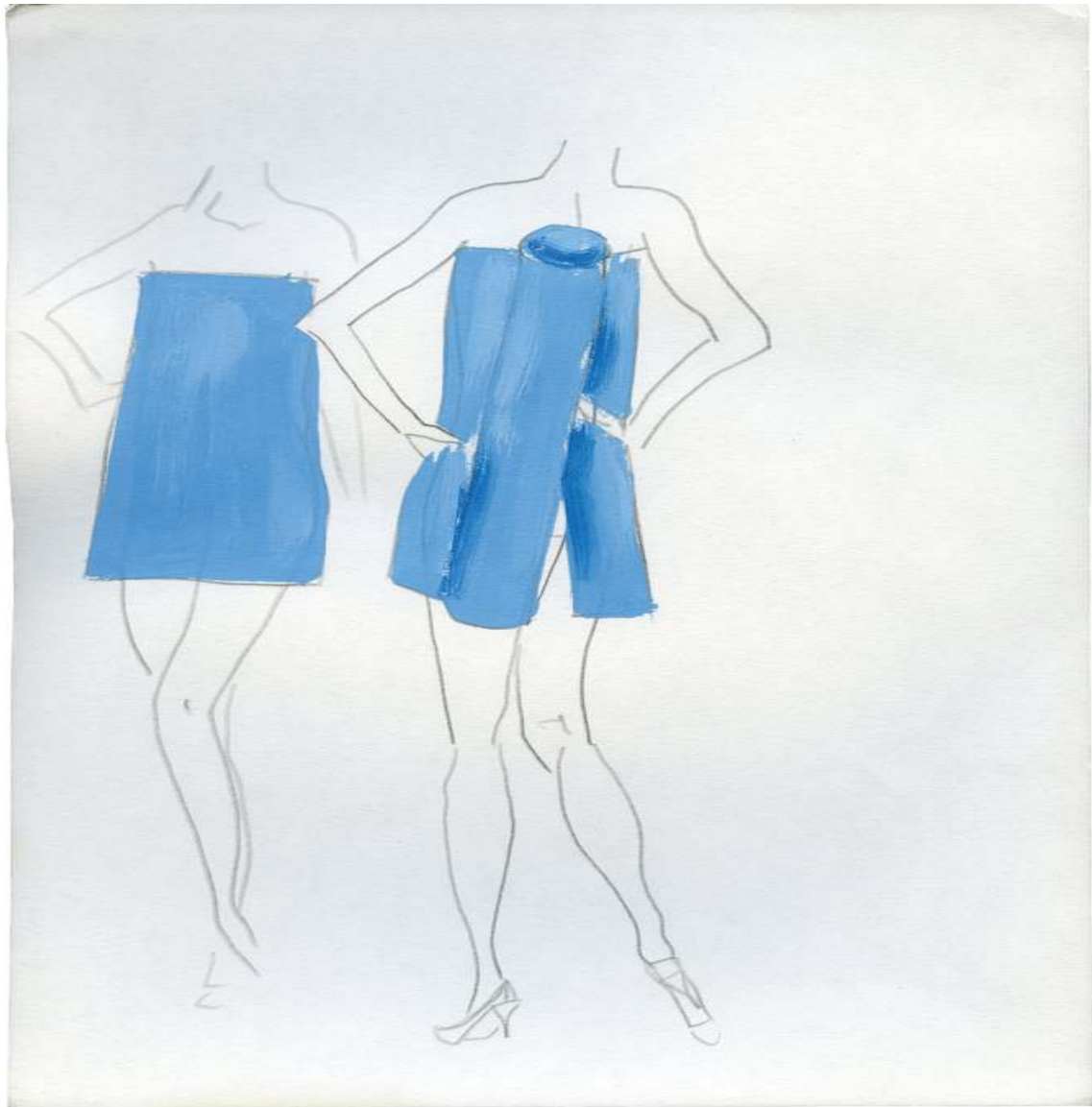
Design for En Vogue Drawing and Collage 10 x 8¼ inch / 27 x 21 cm 2015