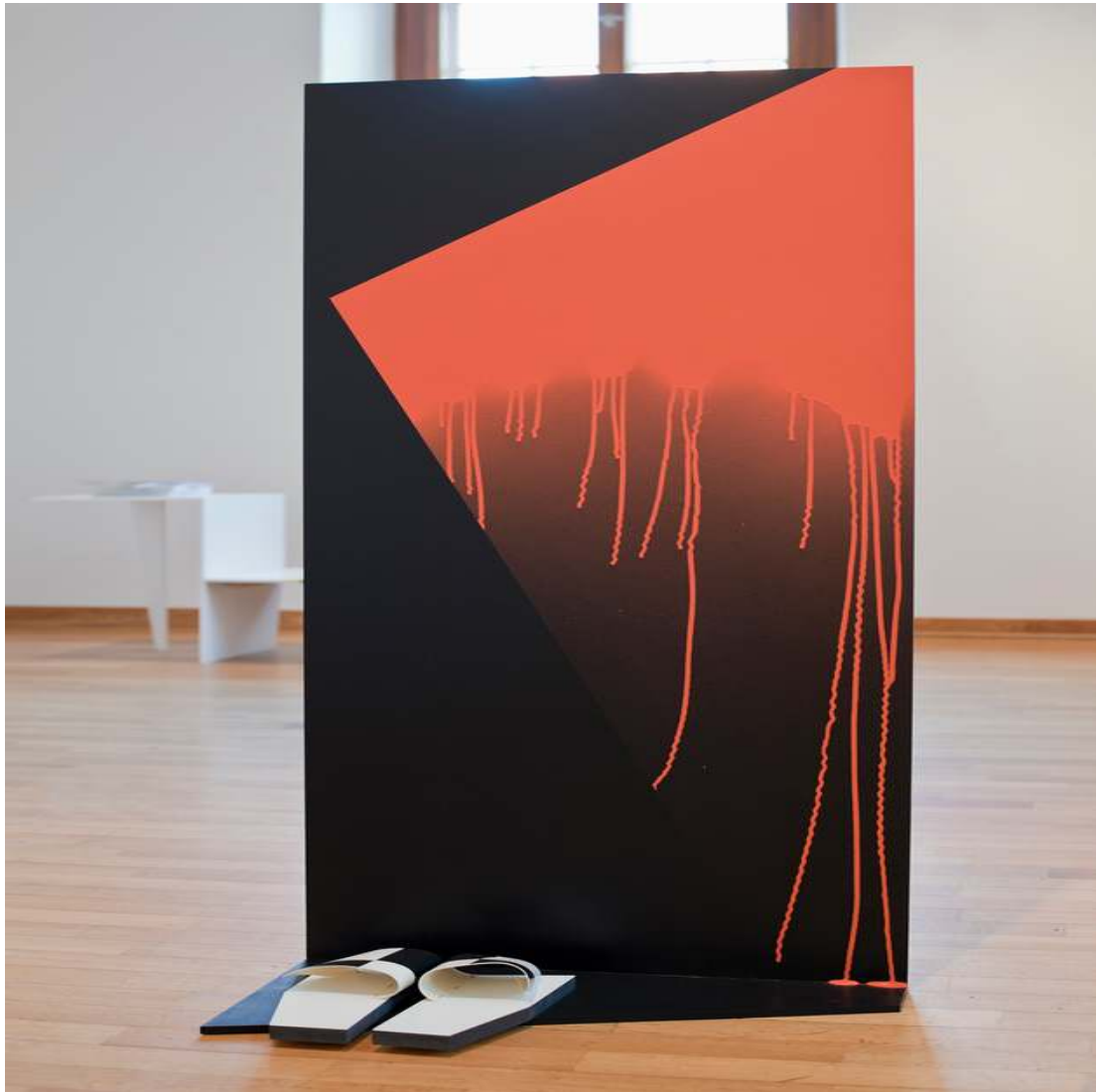
Showcase starring CHIC Installation 2017