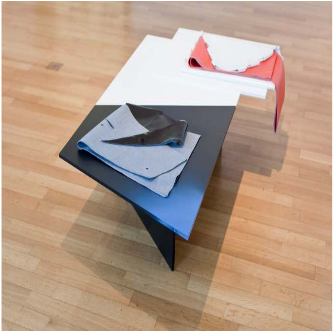
Showcase starring CHIC Installation 2017