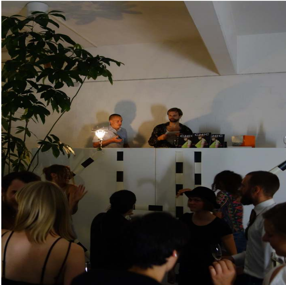
CHIC Release Party DJs PRTMENT 2016