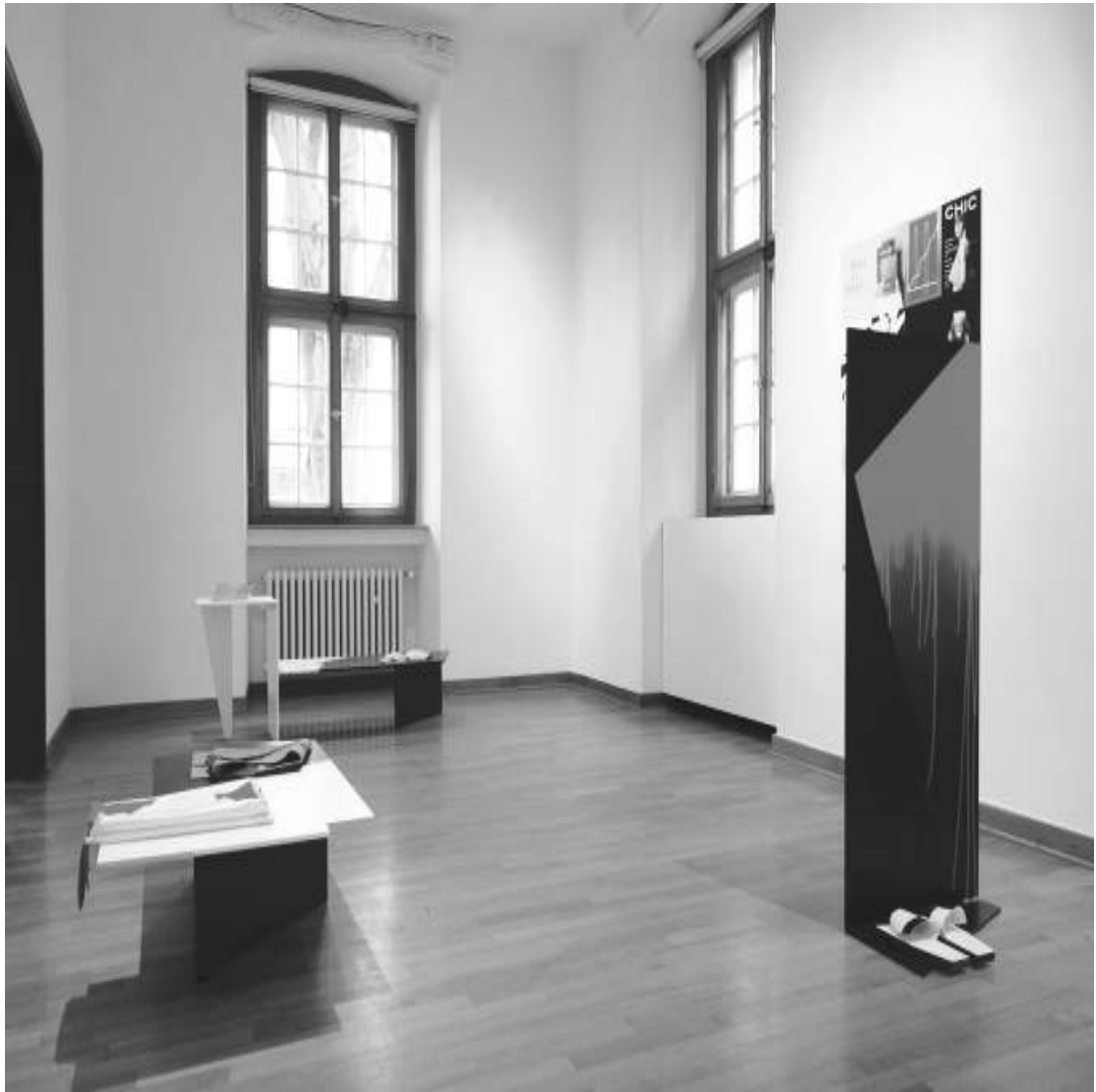
Showcase starring CHIC Installation 2017