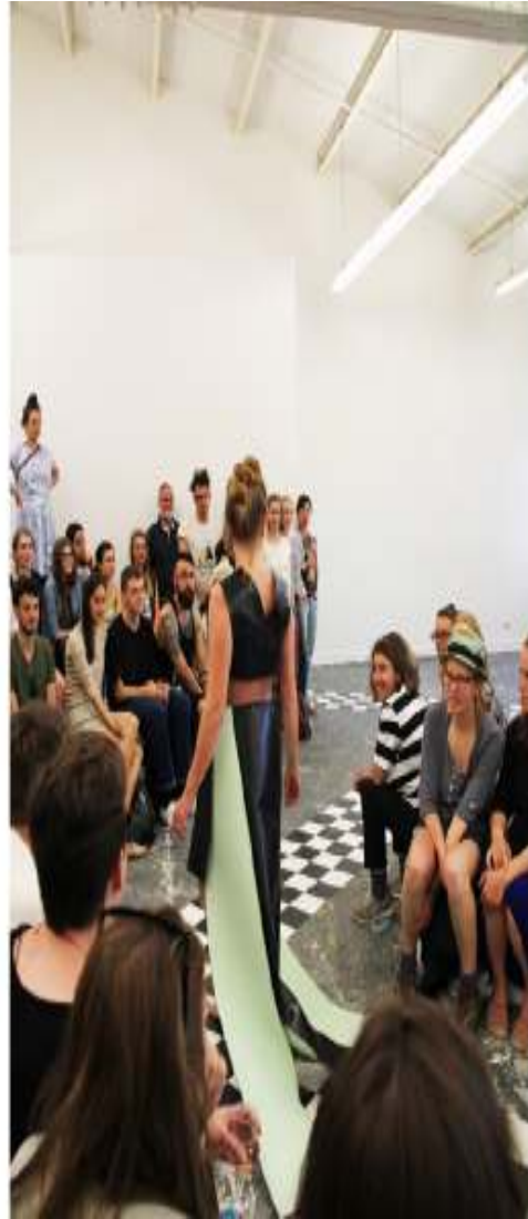
En Vogue Fashion Show (Performance) 2015