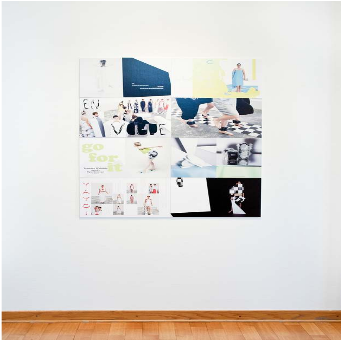
Showcase starring CHIC Installation Pictures