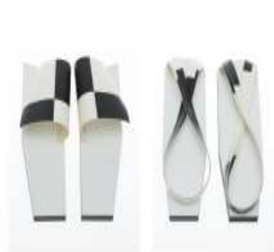
Unwalkables black MDF white coated, PVC 10 x 3¼ x 3¼ inch / 27 x 10 x 10 cm 2015