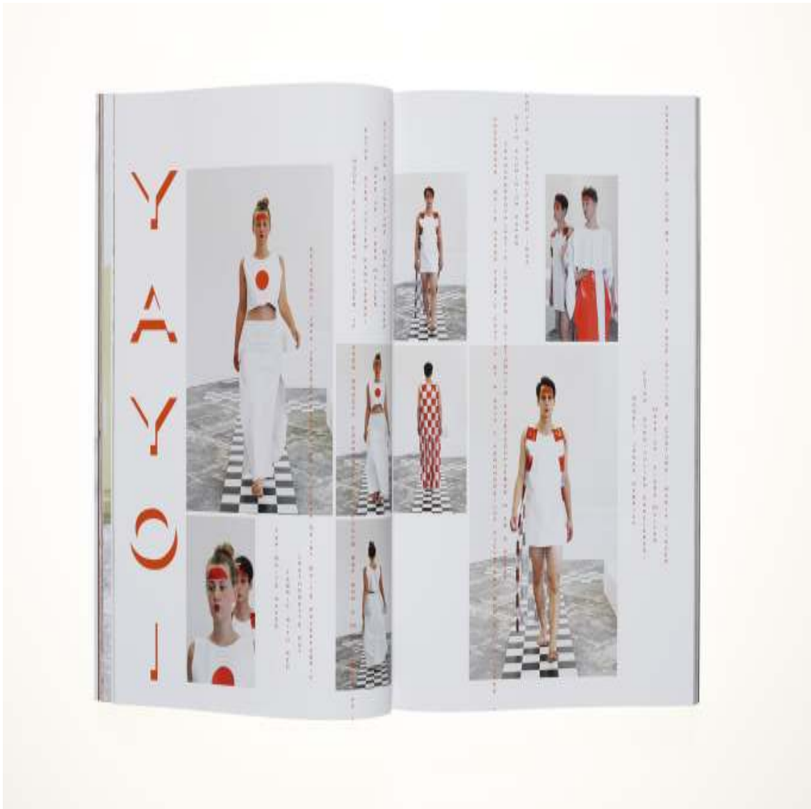
CHIC Magazine 10¼ x 8 inch / 27.7 x 21.3 cm 2016