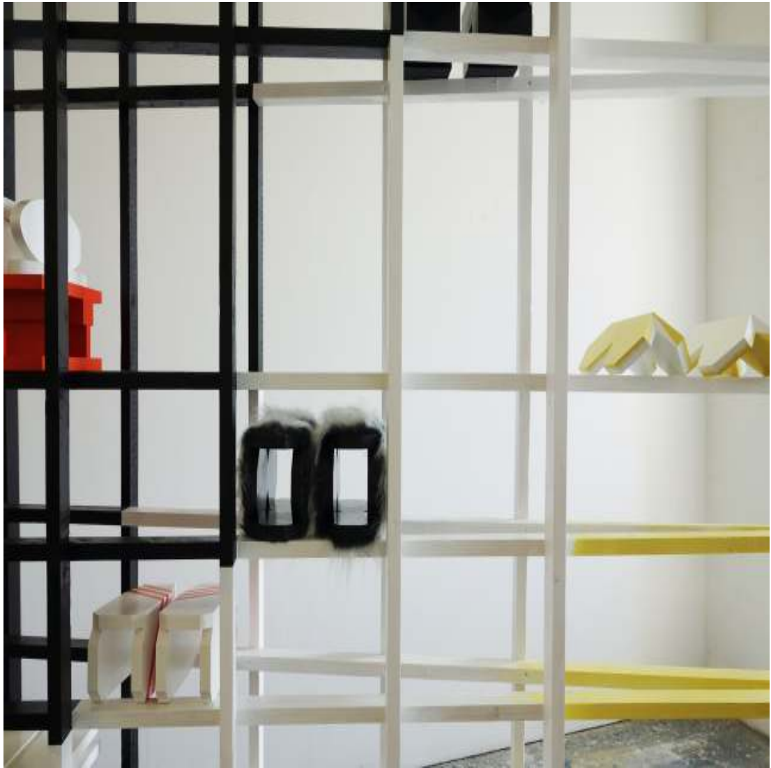
Ark Collection 118 x 78 x 15¼ inch / 300 x 200 x 40 cm 2016