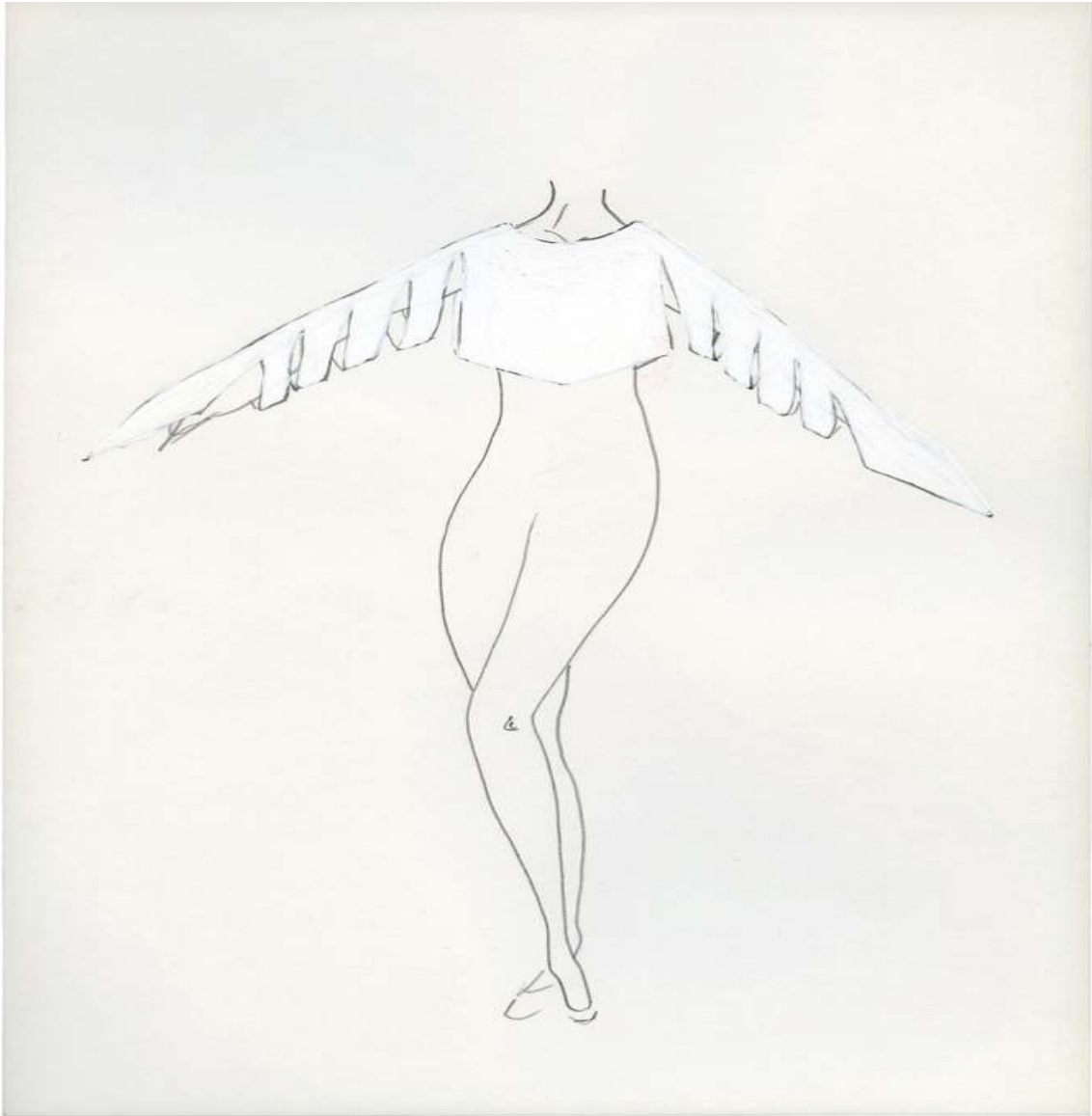
Design for En Vogue Drawing and Collage 10 x 8¼ inch / 27 x 21 cm 2015