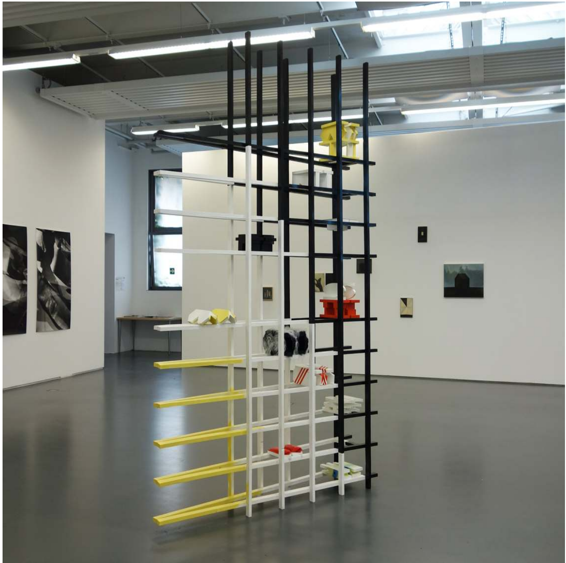
Ark Collection 118 x 78 x 15¼ inch / 300 x 200 x 40 cm 2016