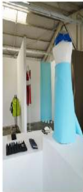
Shop Installation 2015