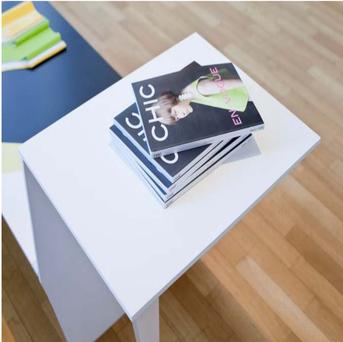
Showcase starring CHIC Installation 2017