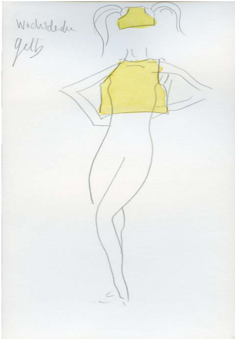
Design for En Vogue Drawing and Collage 10 x 5¾ inch / 27 x 15 cm 2015