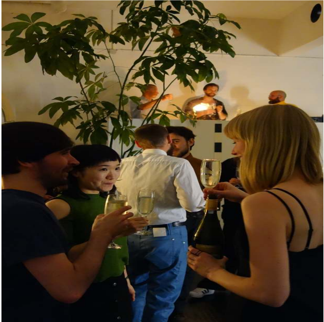
CHIC Release Party 2016