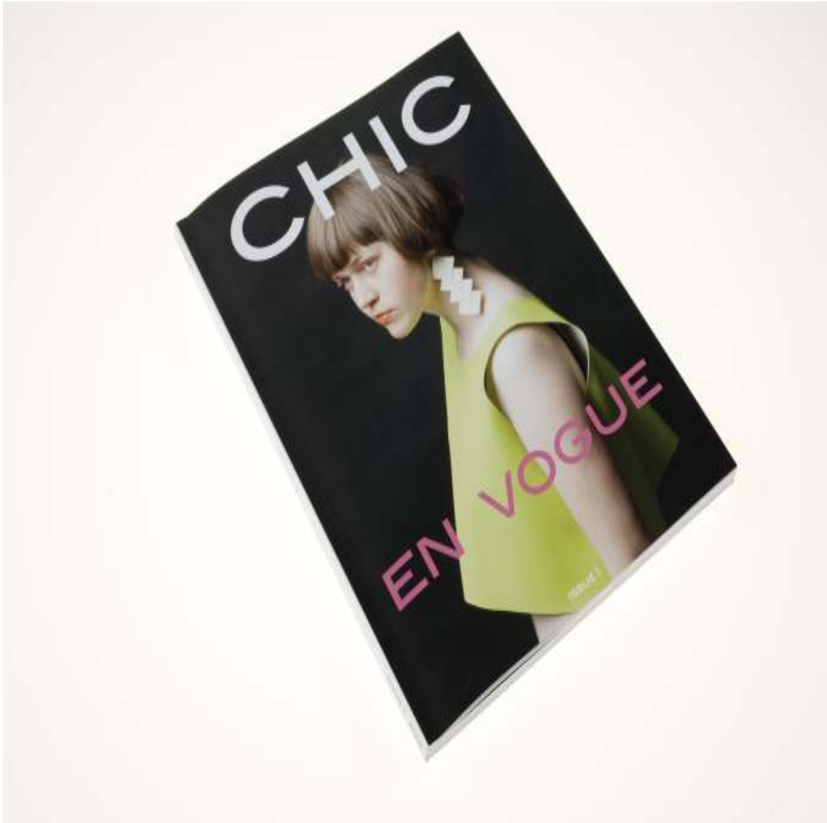
CHIC Magazine 10¼ x 8 inch / 27.7 x 21.3 cm 2016