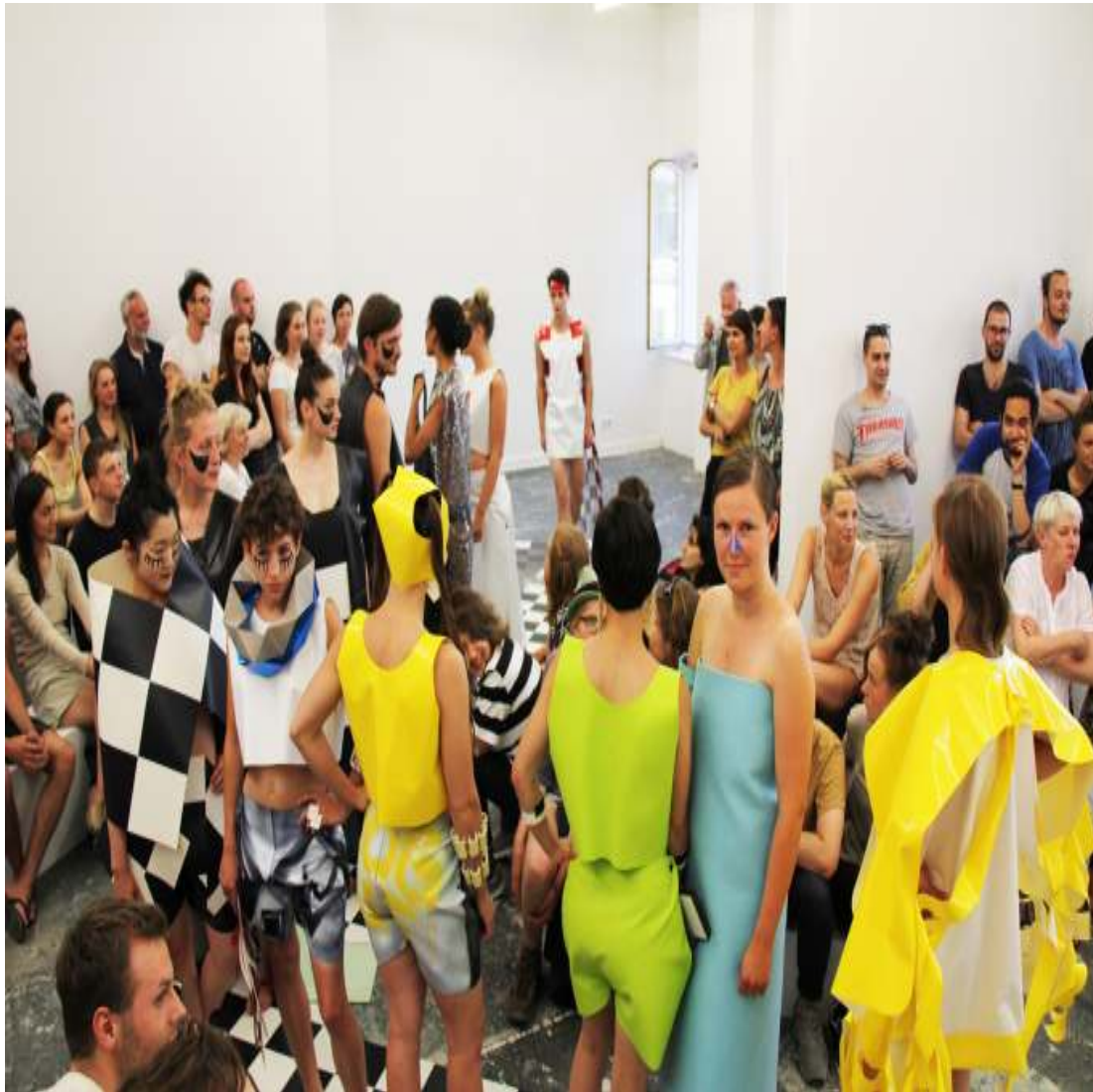
En Vogue Fashion Show (Performance) Music by Friederike Jäger 2015