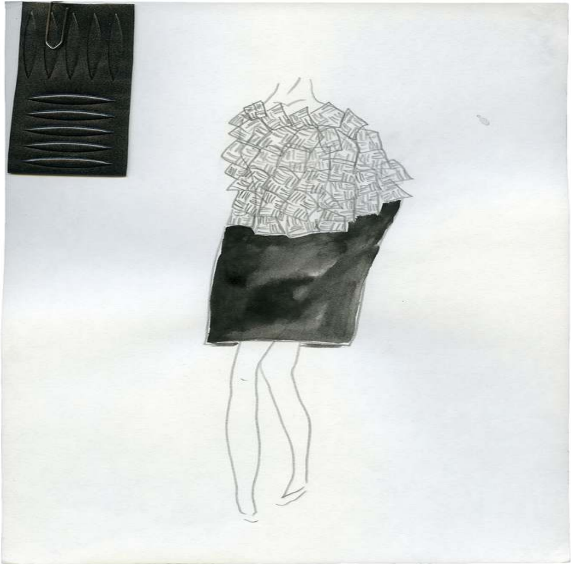
Design for En Vogue Drawing and Collage 10 x 8¼ inch / 27 x 21 cm 2015