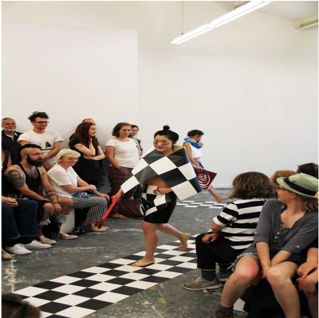
En Vogue Fashion Show (Performance) 2015