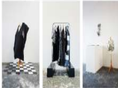
Shop Installation 2015