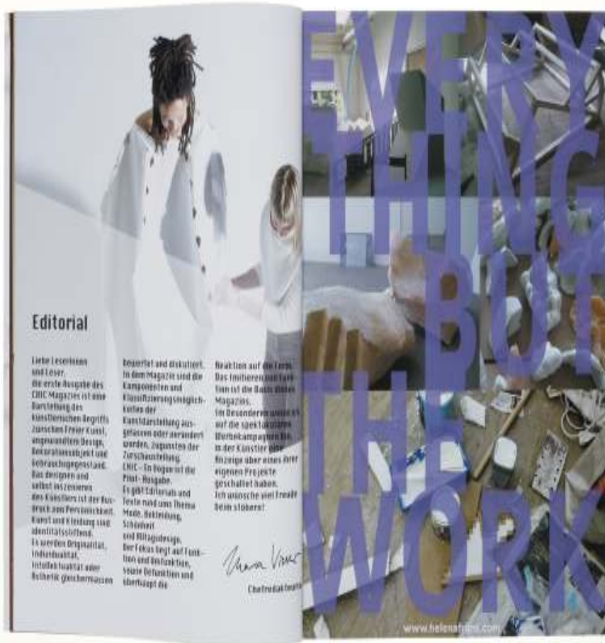
CHIC Magazine 10 1/4 x 8 inch / 27.7 x 21.3 cm 2016