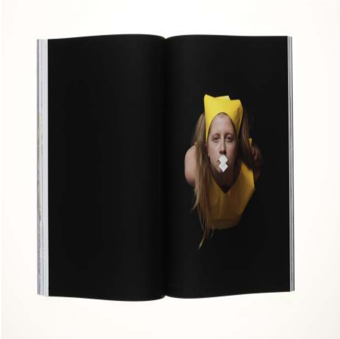
CHIC Magazine Photographs in collaboration with Michael Lucero 10¾ x 8 inch / 27.7 x 21.3 cm 2016