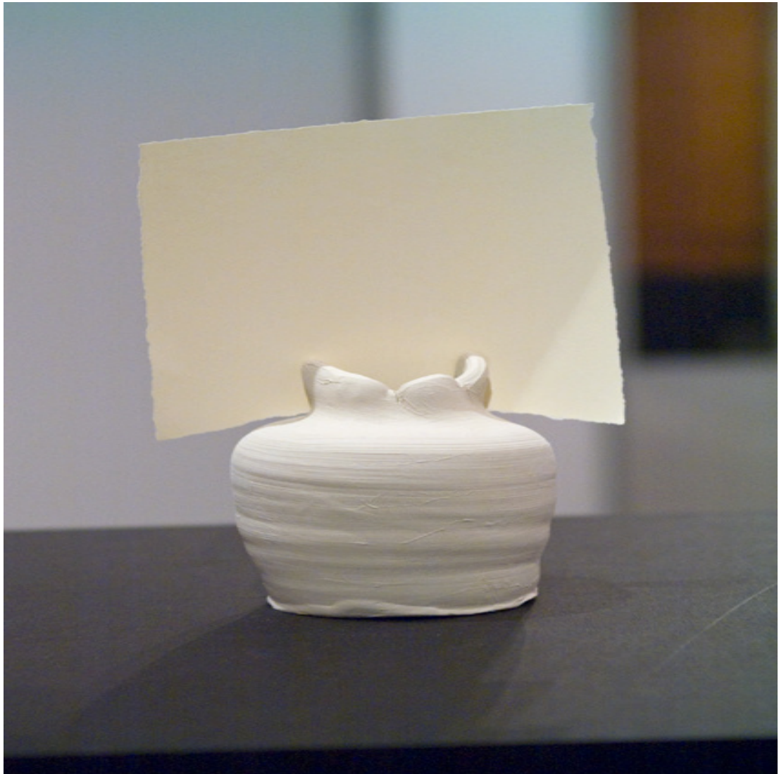
Detail (aus Hasu) 2013