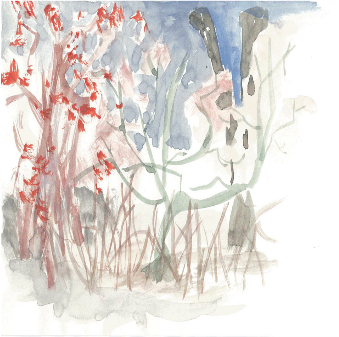
Ohne Titel (aus Zeichnungen) Tuschezeichnung Tusche auf Papier 21 × 29,7 cm 2012