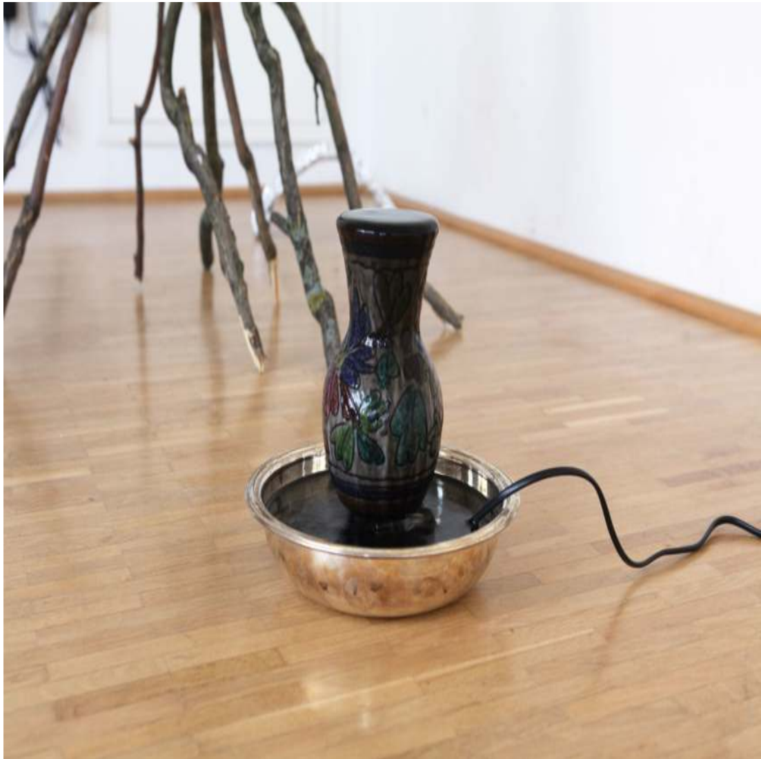
ein Zoo aller Form Installation DinA4-Rahmen, Text, verschiedene Materialien Maße variabel 2013