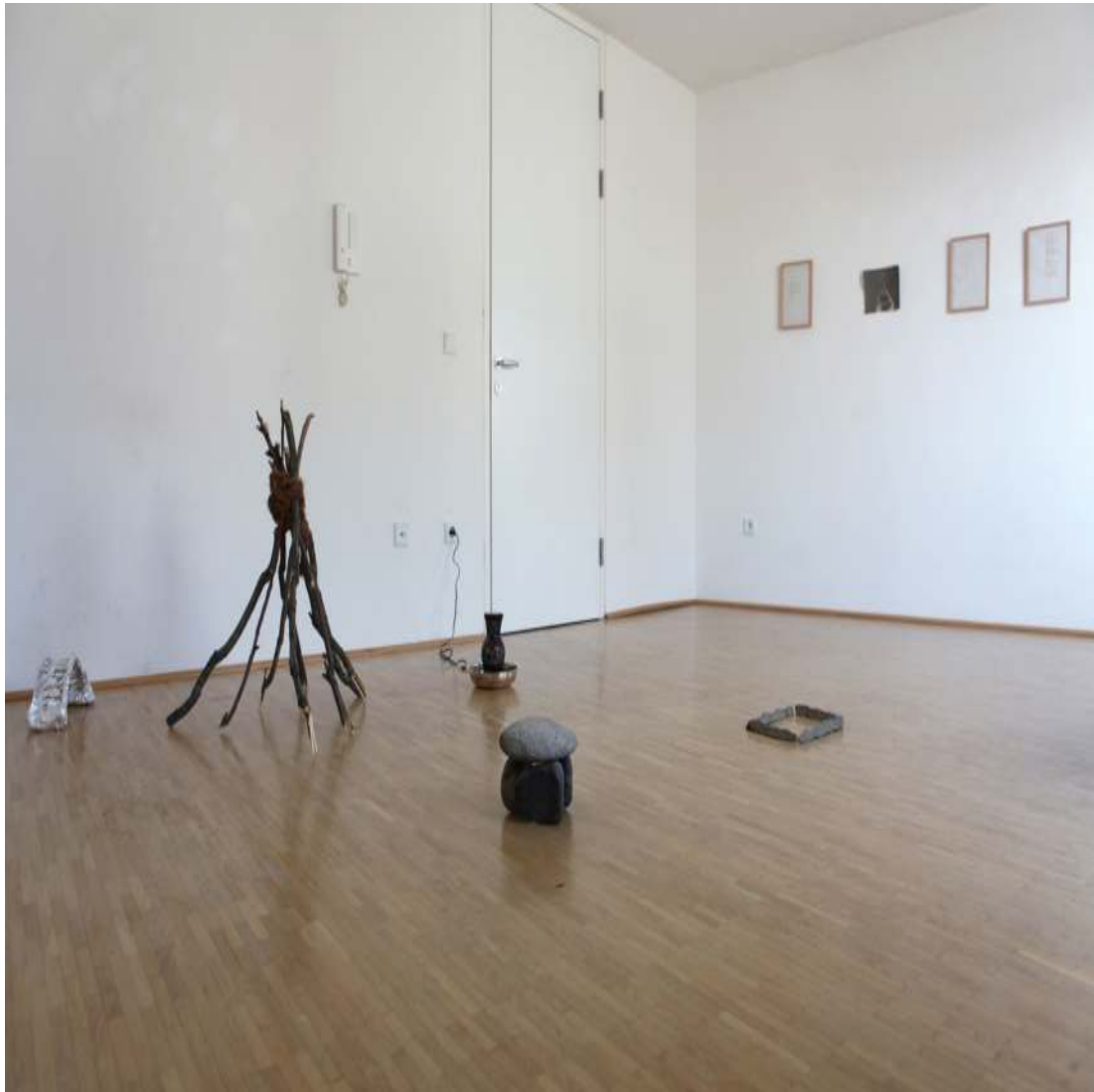
ein Zoo aller Form Installation DinA4-Rahmen, Text, verschiedene Materialien Maße variabel 2013