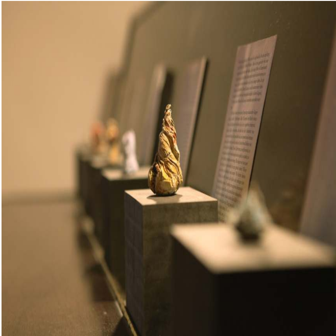
Alcorno Los Alamos Installation Detail Maße variabel 2013