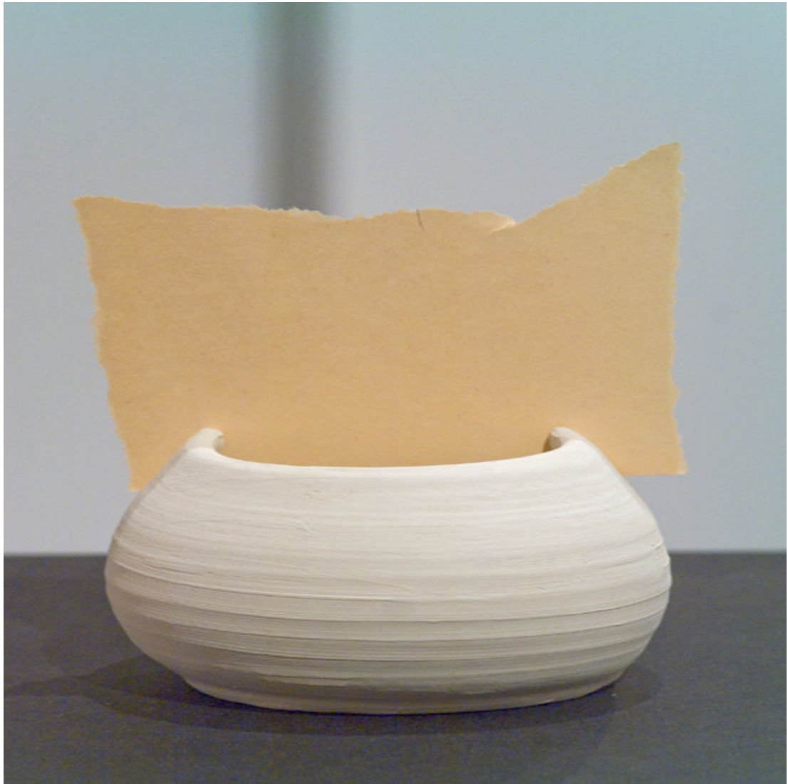
Detail (aus Hasu) 2013