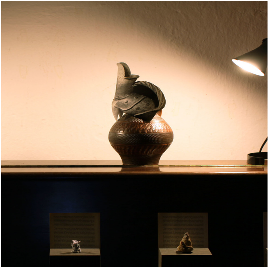
Alcornoque Los Alamos Installation Detail Maße variabel 2013