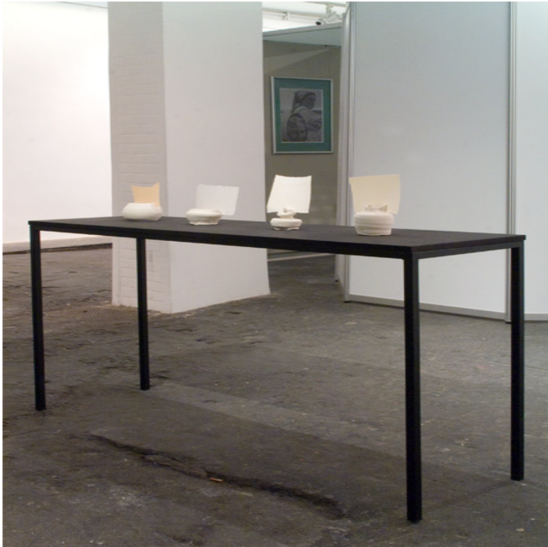
Hasu Installation Stahl, MDF, Ton (ungebrannt), Papier 150 x 90 x 40 cm 2013