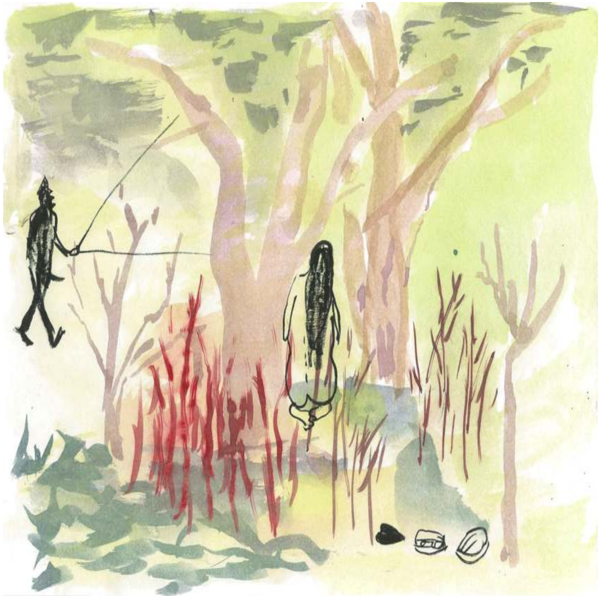
Taschenlampenmann (aus Zeichnungen) Tuschezeichnung Tusche auf Papier 21 × 29,7 cm 2012