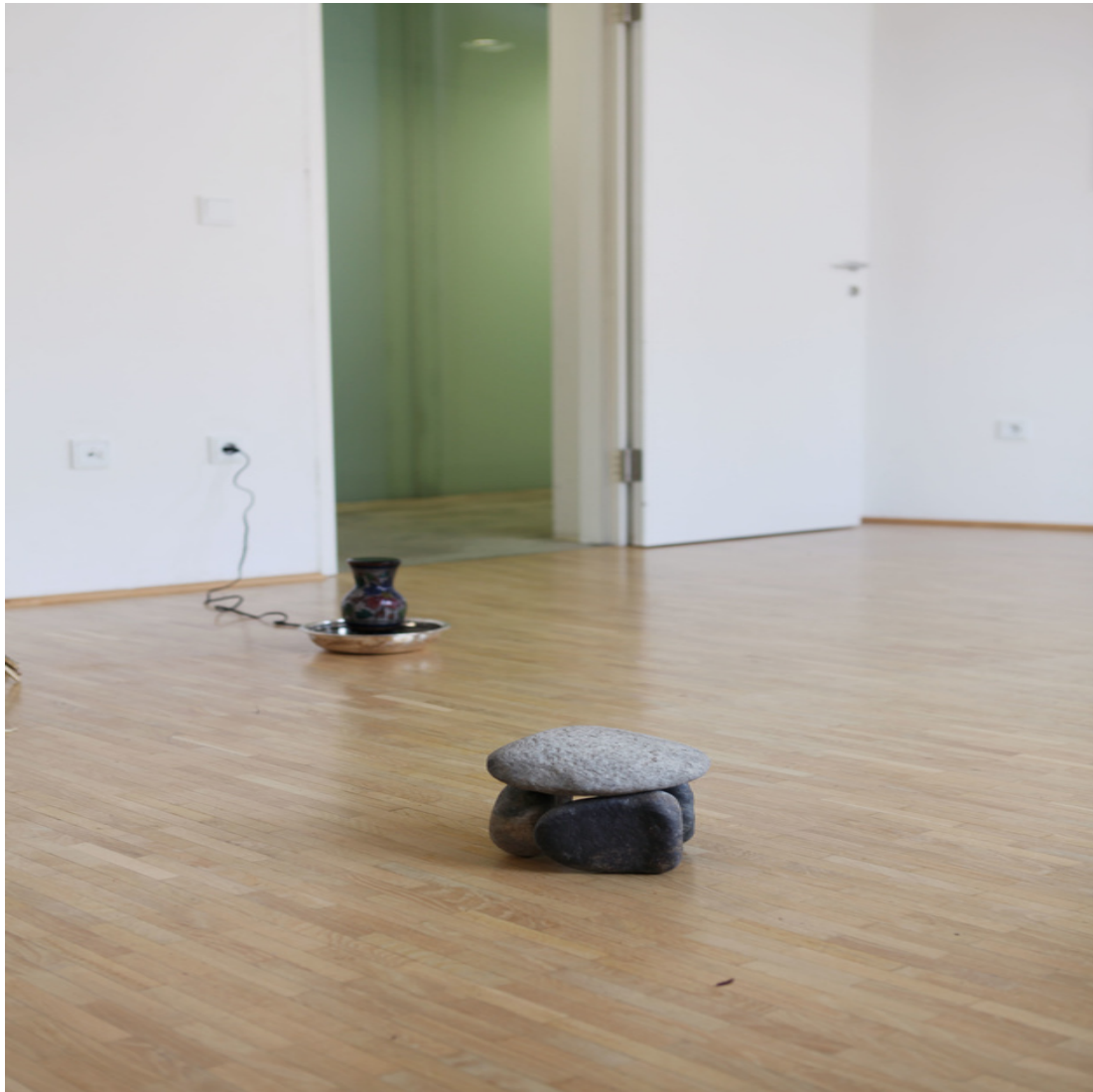
ein Zoo aller Form Installation DinA4-Rahmen, Text, verschiedene Materialien Maße variabel 2013