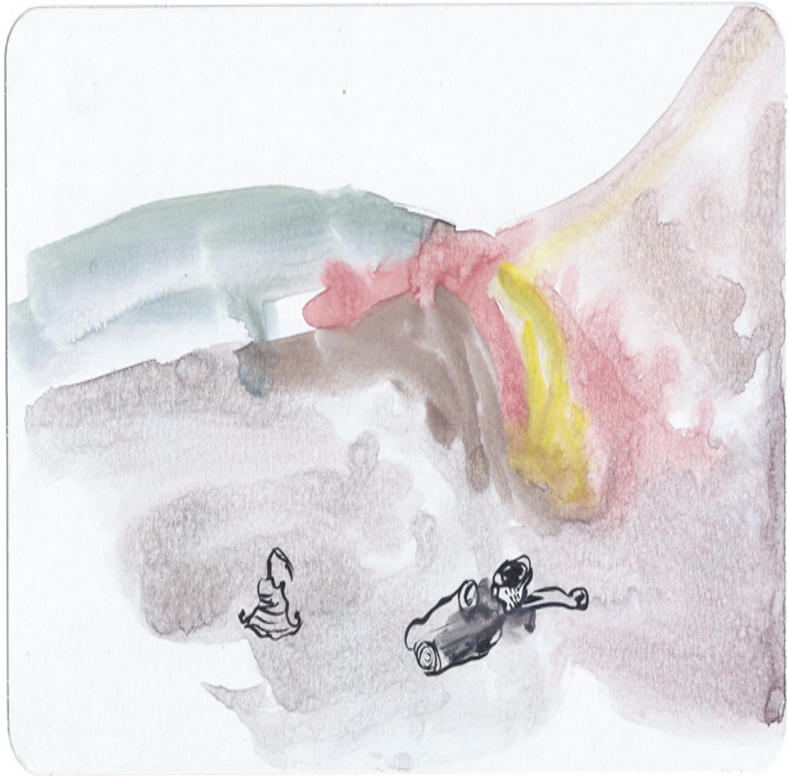
Ohne Titel (aus Zeichnungen) Tuschezeichnung Tusche, Tinte auf Karton 16 × 25 cm 2013