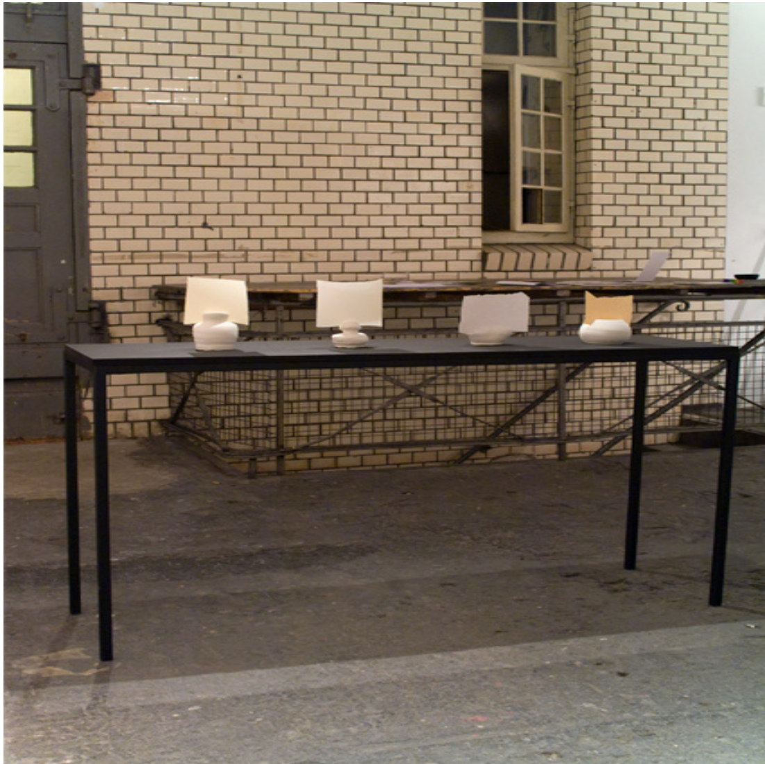
Hasu Installation Stahl, MDF, Ton (ungebrannt), Papier 150 x 90 x 40 cm 2013