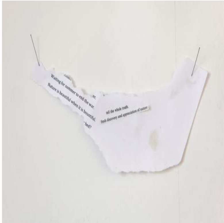
Dialog (Fragment) (aus ein Zoo aller Form) Papier mit s/w Druck, cut-ups, Nadeln 13 × 20 cm Maße variabel 2013