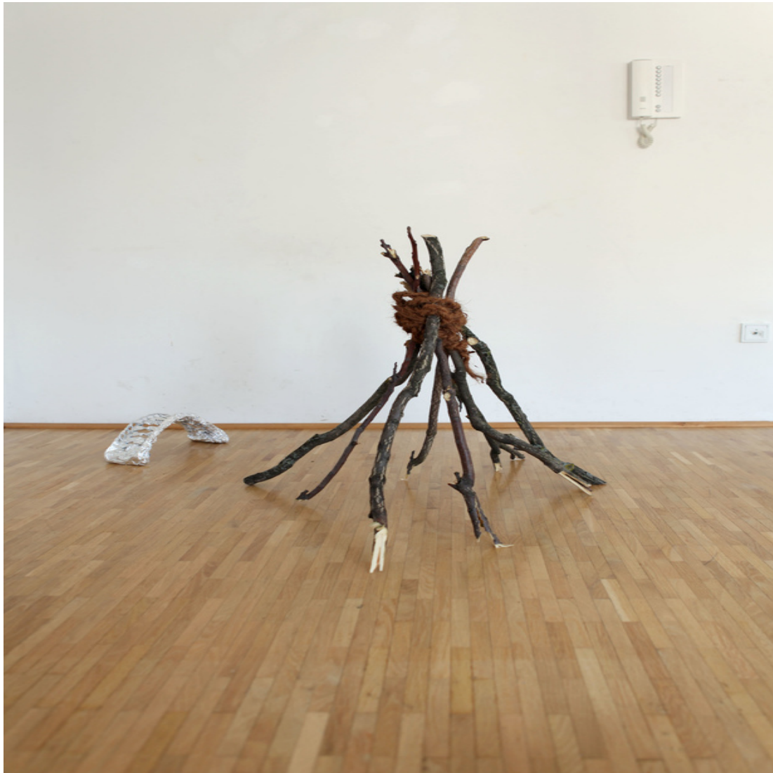
ein Zoo aller Form Installation DinA4-Rahmen, Text, verschiedene Materialien Maße variabel 2013