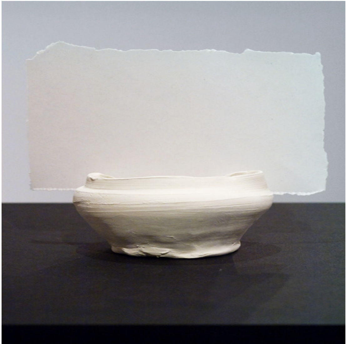
Detail (aus Hasu) 2013