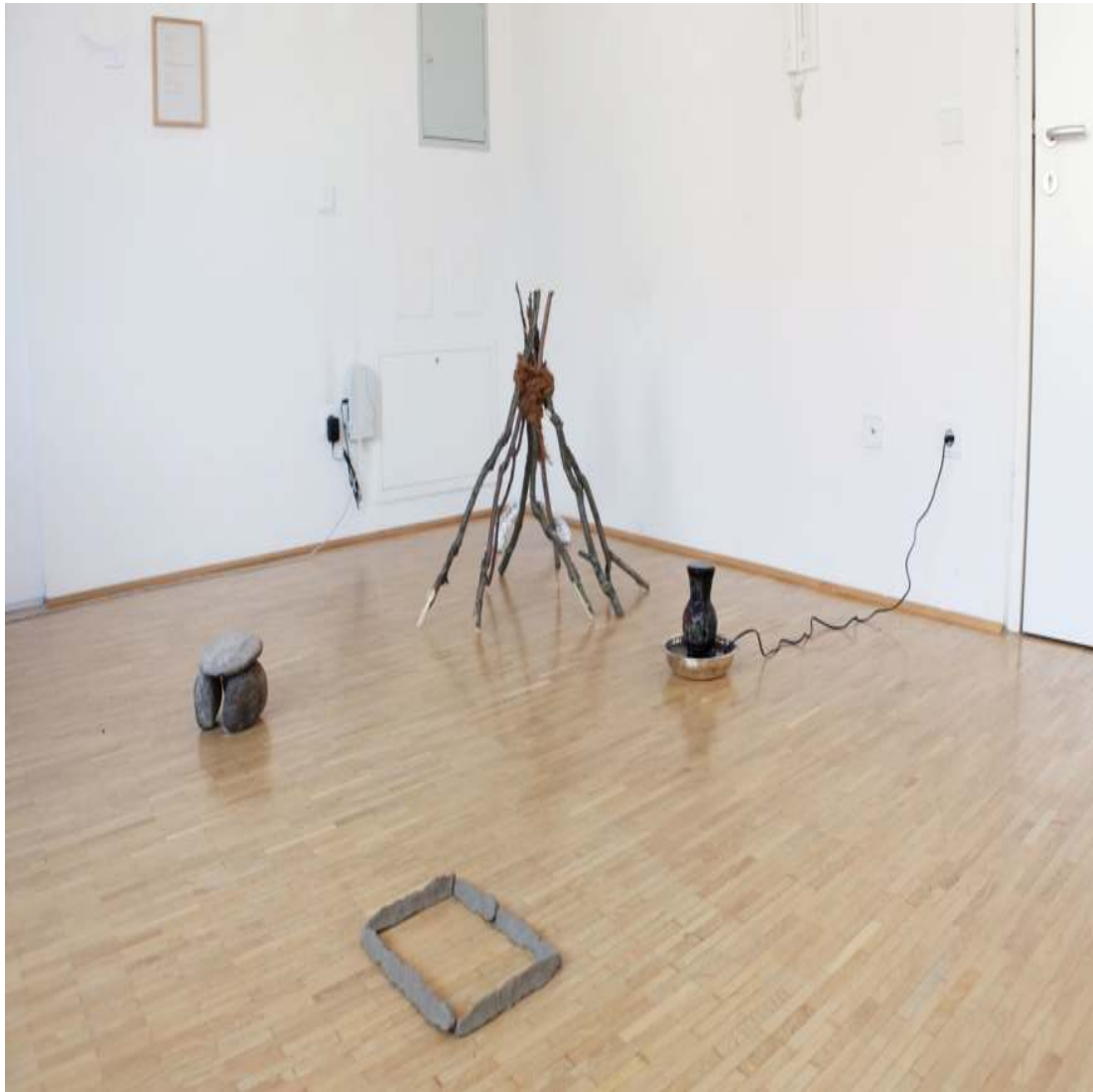
ein Zoo aller Form Installation DinA4-Rahmen, Text, verschiedene Materialien Maße variabel 2013