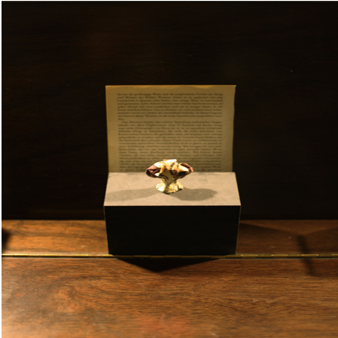
Alcamo Los Alamos Installation Detail Maße variabel 2013