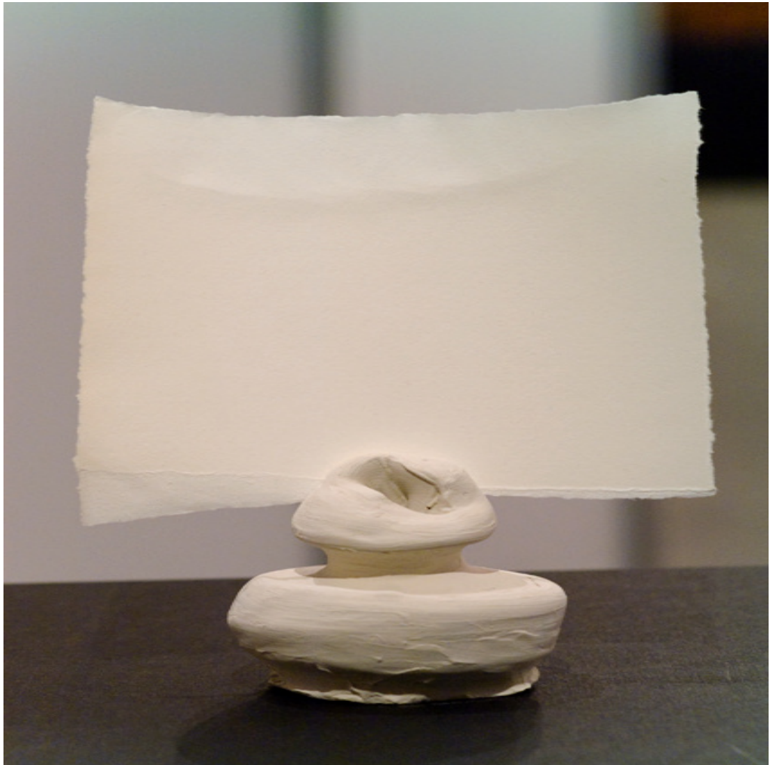
Ohne Titel (aus Hasu) 2013