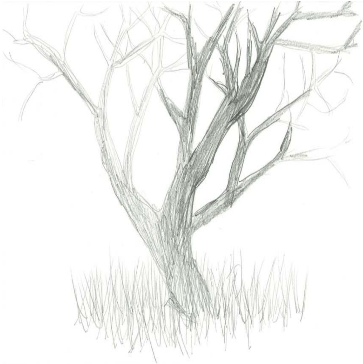
Ohne Titel (aus Zeichnungen) Zeichnung Bleistift auf Papier 21 × 29,7 cm 2012