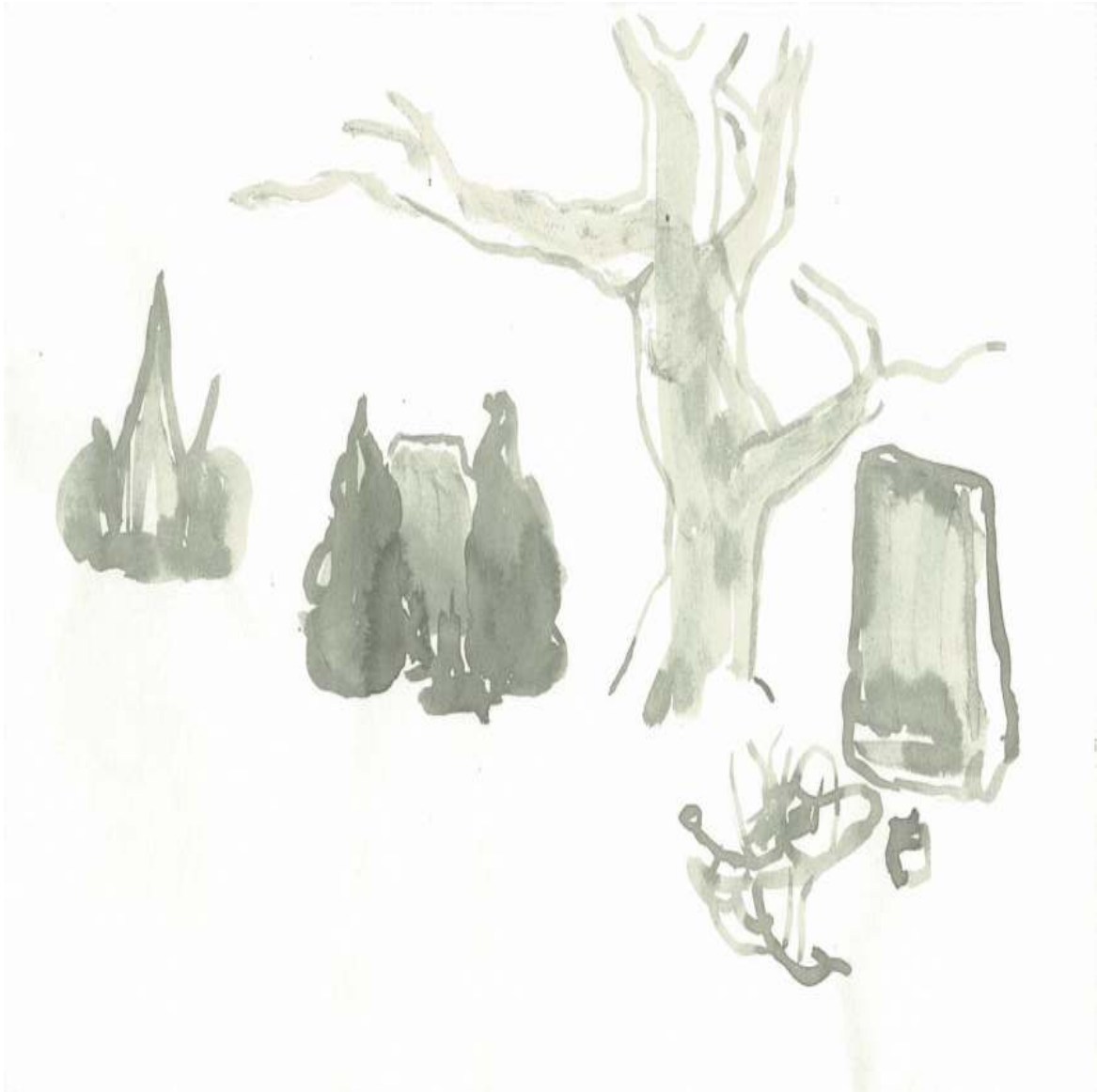
Ohne Titel (aus Zeichnungen) Tuschezeichnung Tusche auf Papier 21 × 29,7 cm 2012