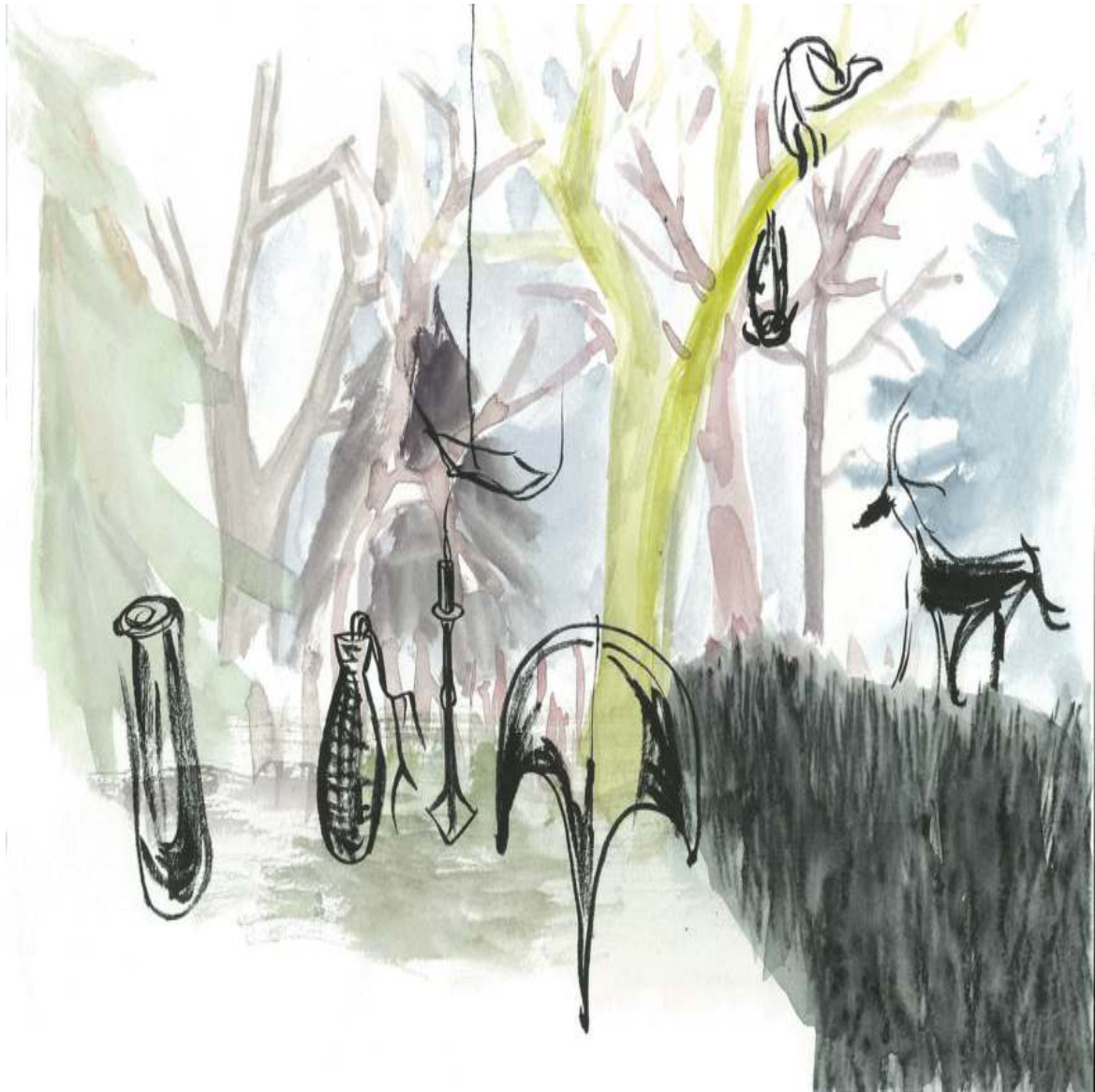
ohne Titel (aus Zeichnungen) Tuschezeichnung Tusche, Tinte auf Papier 21 × 29,7 cm 2012