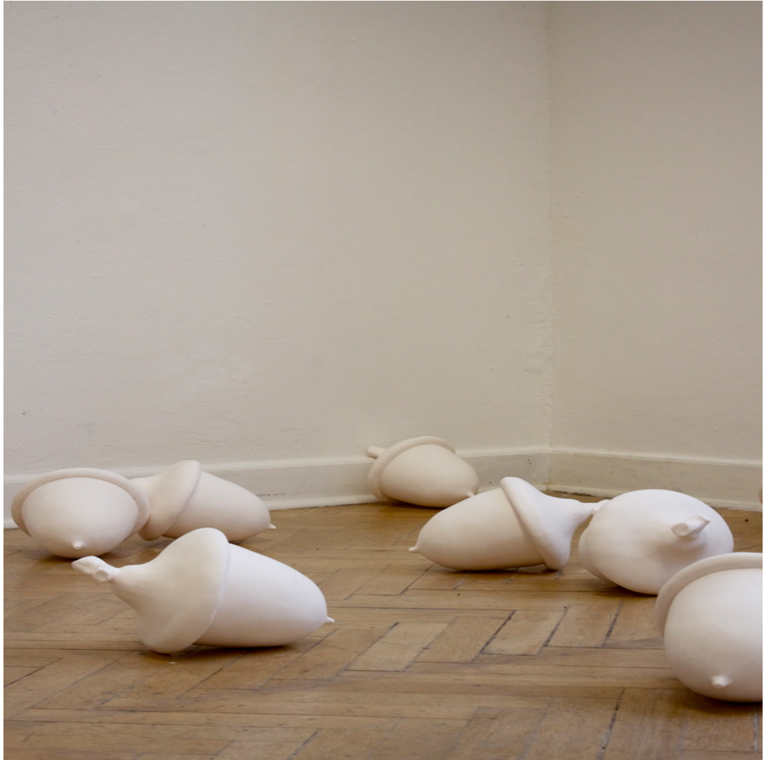
Untitled variable in size 2011