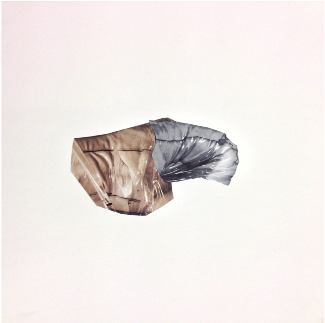
Ohne Titel (aus o.T.) 2014