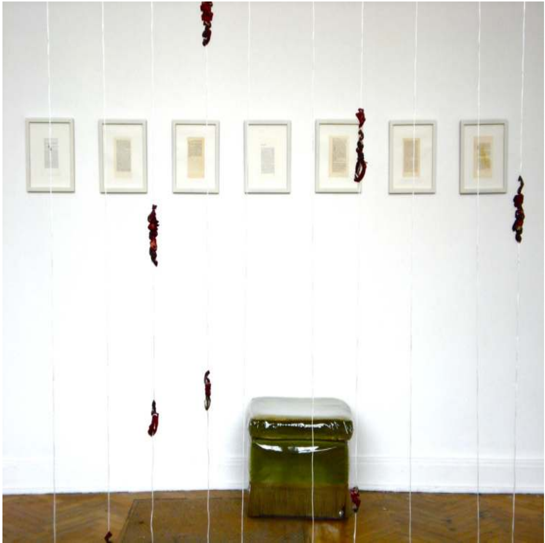
Ohne Titel (aus Seiten) 2011