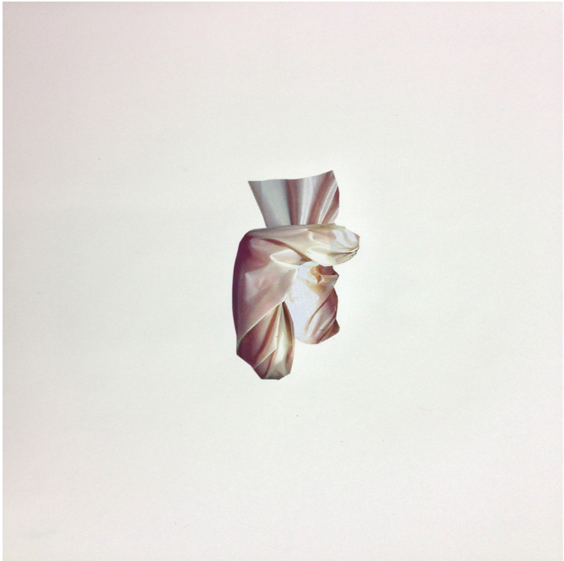
Ohne Titel (aus o.T.) Collage 2014