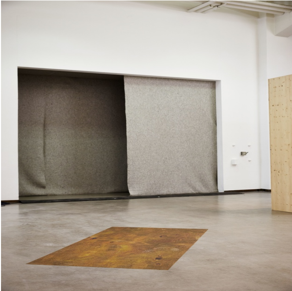
Ohne Titel (aus o.T. (Messing)) Messing Druck 100 x 200 cm 2013