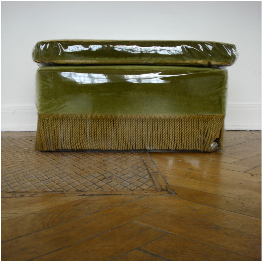
Ohne Titel (aus Seiten) 2011