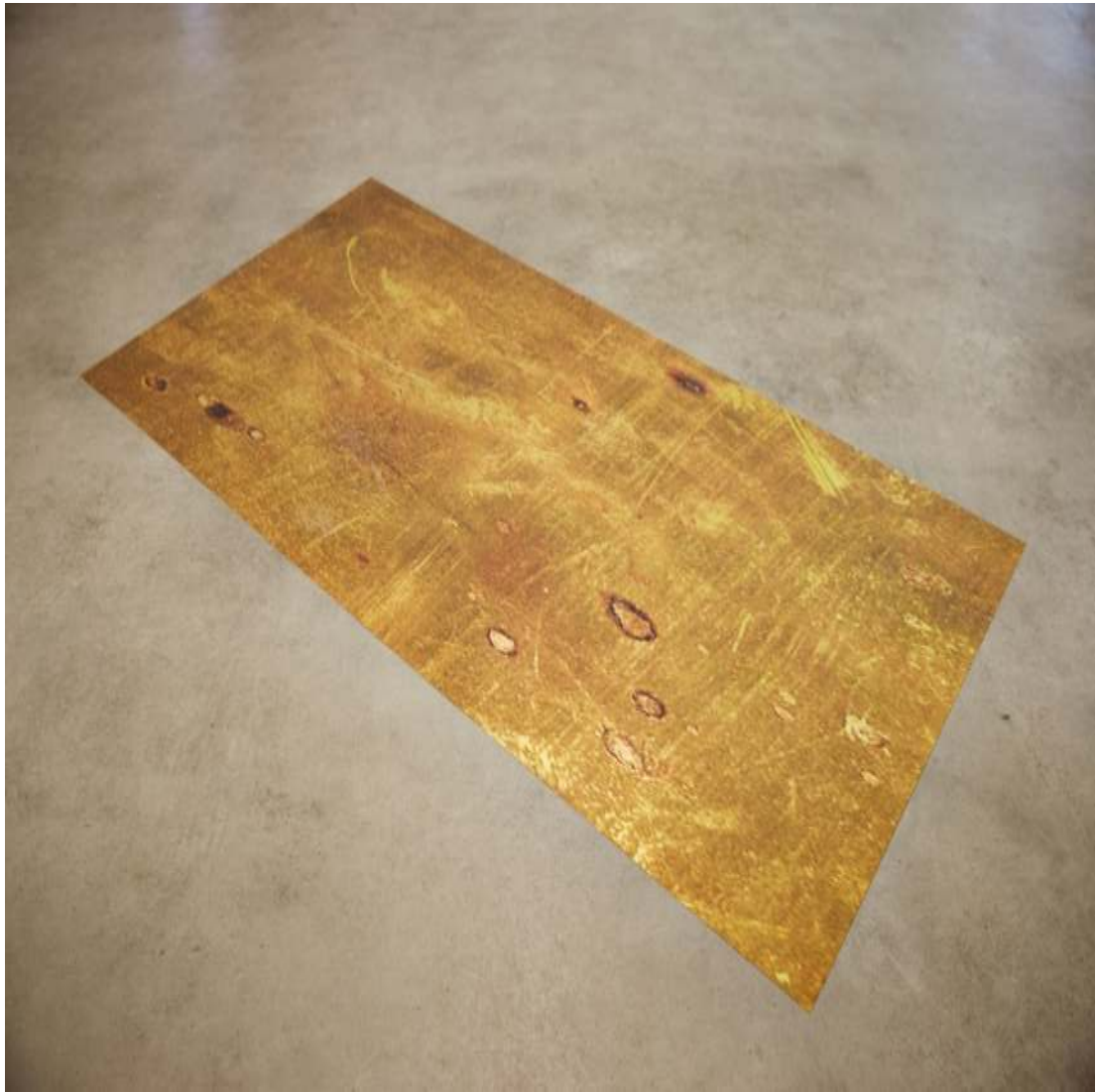
Ohne Titel (aus o.T. (Messing)) 2013