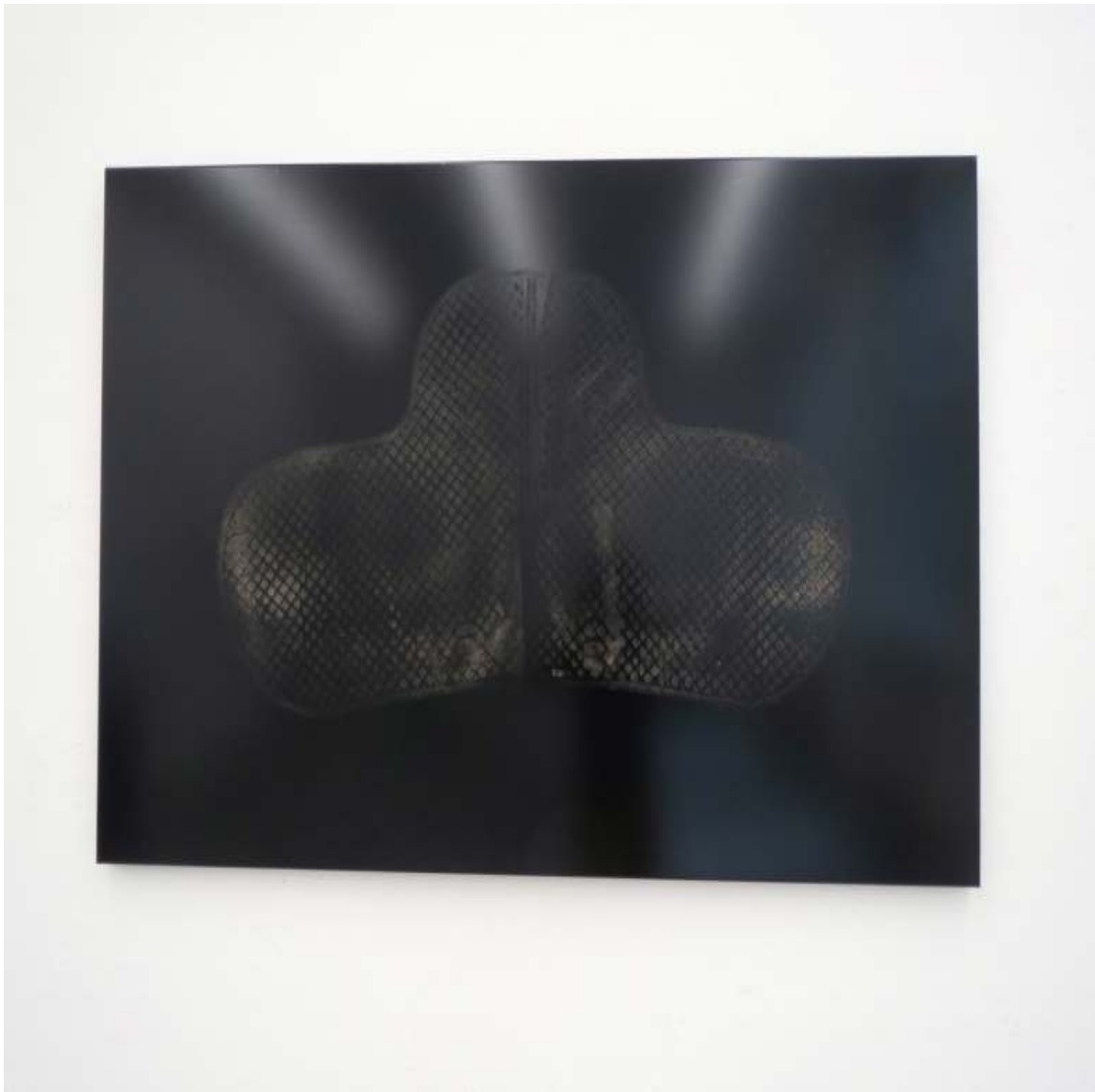
Schabracke Abdruck auf Folie 100 x 200 cm 2013