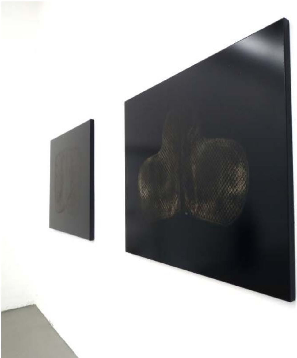
Schabracke Abdruck auf Folie 100 x 200 cm 2013