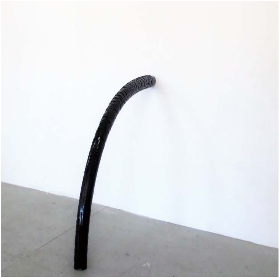
Uninspired Rainbow Installation Klobürstenhalter Maße variabel 2015