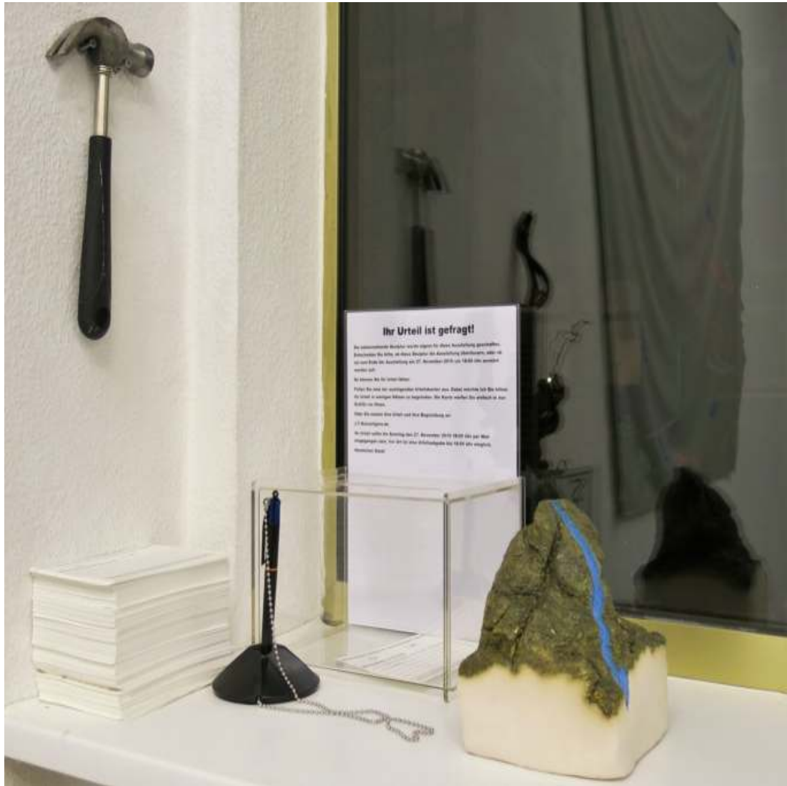
Das Urteil Konzeptuelle Arbeit Gebrannte Keramik, Stimmzettel, Wahlbox, Kugelschreiber, Hammer Maße variabel 2016