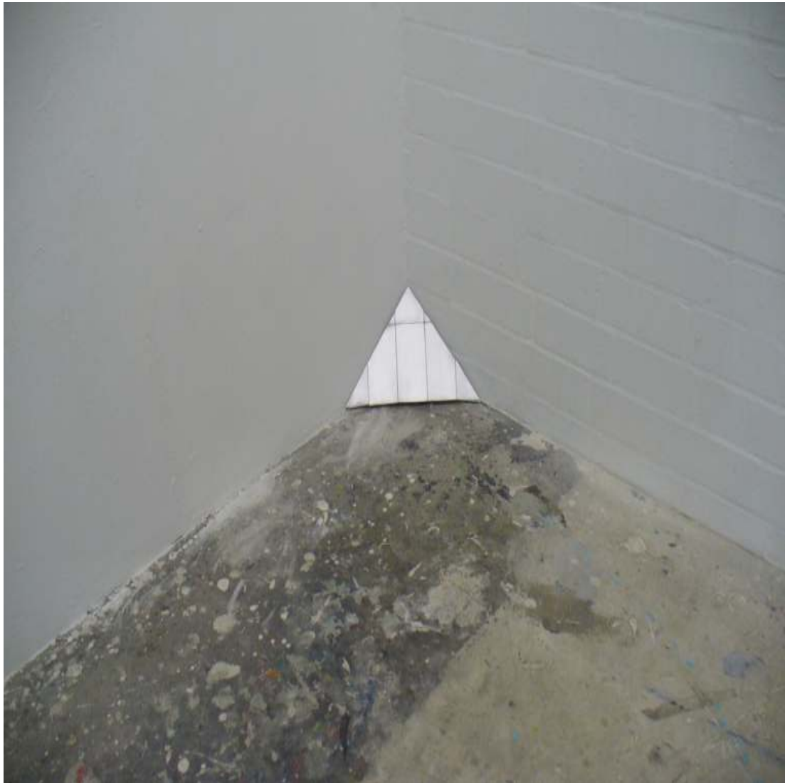
Fettarme Ecke Installation Tetrapackungen von fettarmer Milch, Klebstoff 30 × 25 × 25 cm 2011