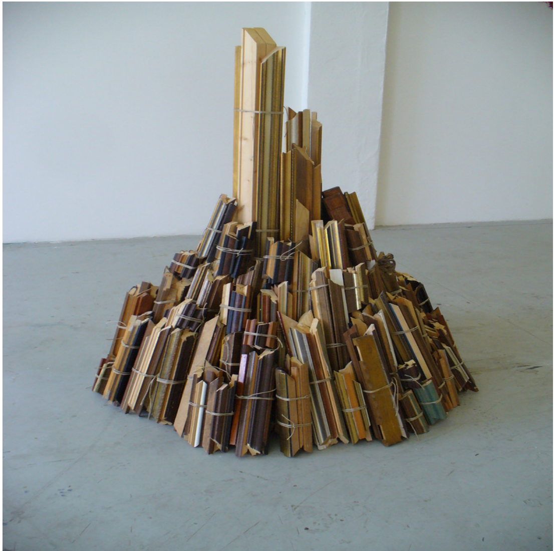
Farewell to Giordano Bruno Installation Bilderrahmen, Paketschnur 100 cm 2013