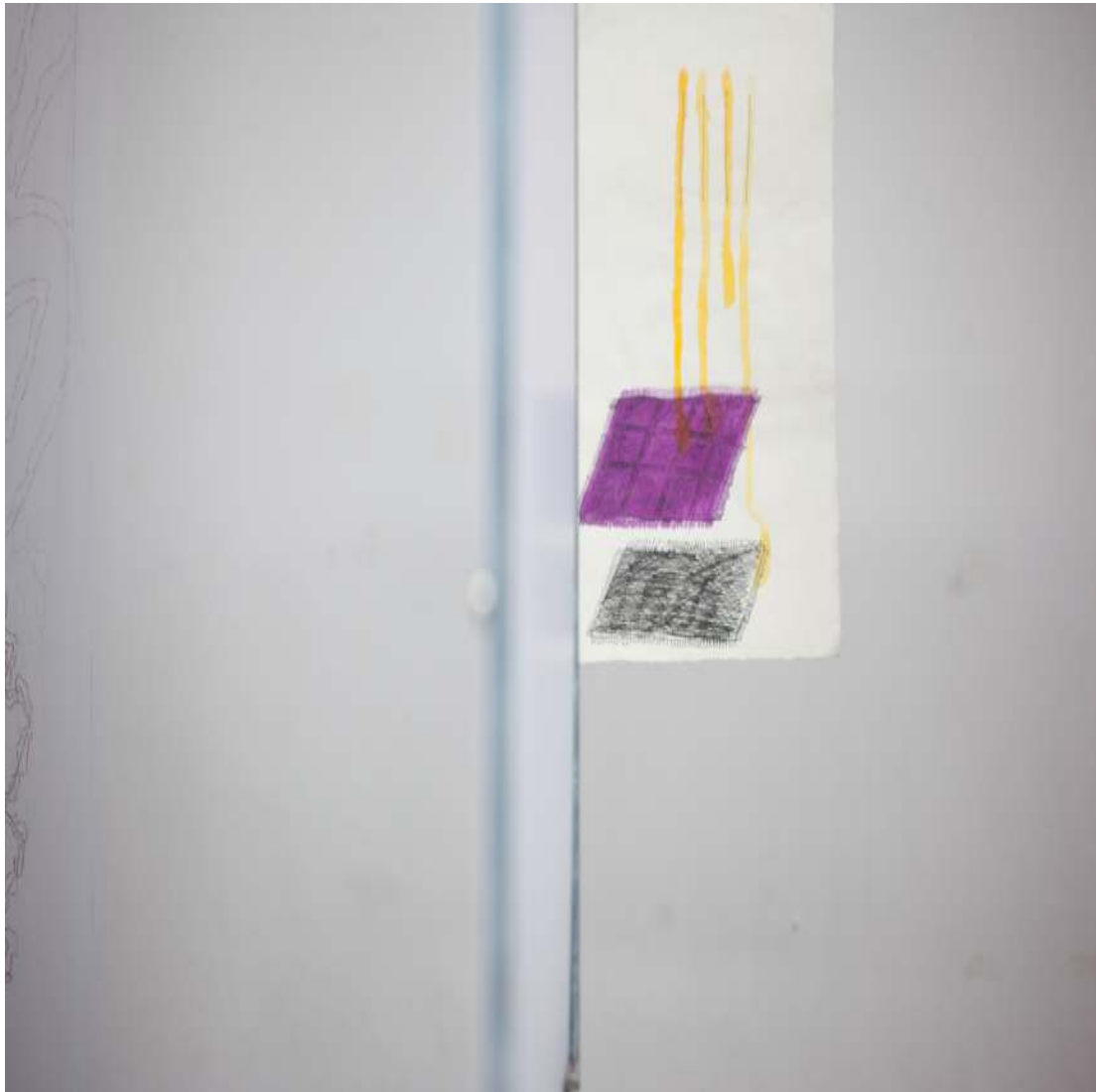
Take me through the Acid Rain (aus Kennen sie Turner) Zeichnung Tinte auf Büttenpapier 2017