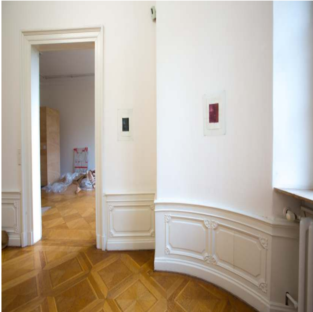
Young and Ignorant Tusche Büttenpapier 30 × 21 cm 2017