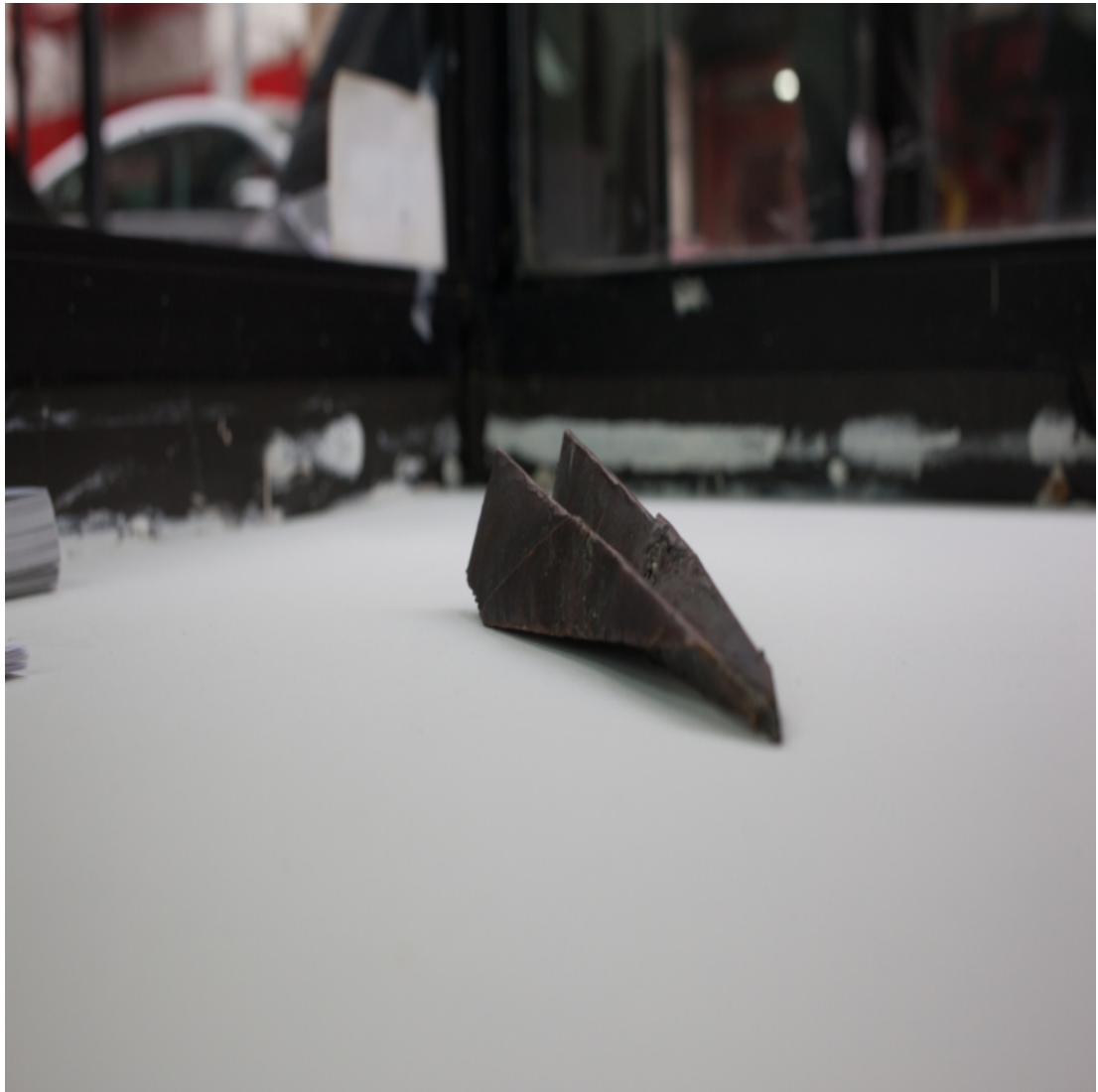
Christopher Gerberding Avion Adult (aus Kennen sie Turner) skulptur Bronze Maße variabel 2017